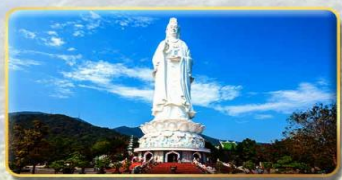
วัดลินห์อิ่ง