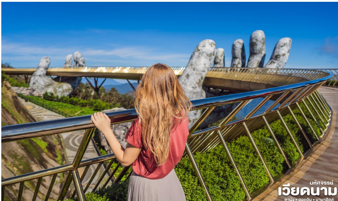
มหัศจรรย์ เวียงคานาม คานัง • ฮอยอัน • มาน้ำฮิลล์

ฟินป่าที่อุดมสมบูรณ์ นำท่านชม สะพานสีทอง สถานที่ท่องเที่ยวใหม่ล่าสุดตั้งโดดเด่น เป็นเอกลักษณ์อย่างสวยงาม บนเขามาน้ำฮิลล์