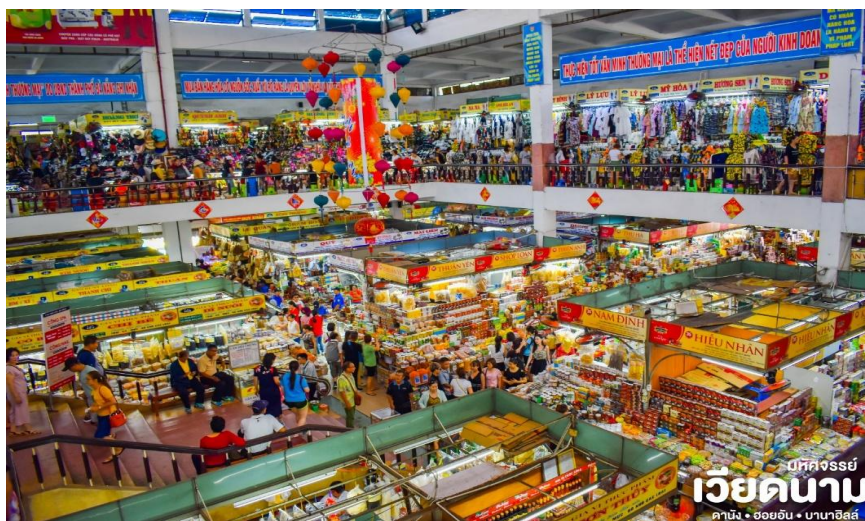
มทศจรรย เวียดนาม ดานัง • ฮอยอัน • บานาฮิลล์

จากนั้น นำท่านเดินเที่ยวและช้อปปิ้งใน ตลาดฮาน (Han Market) ซึ่งก็มีสินค้าหลากหลายชนิด เช่น ผ้า เหล้า บุหรี่ และของกินต่าง ๆ เป็นตลาดสดและขายสินค้าพื้นเมืองของเมืองดานัง