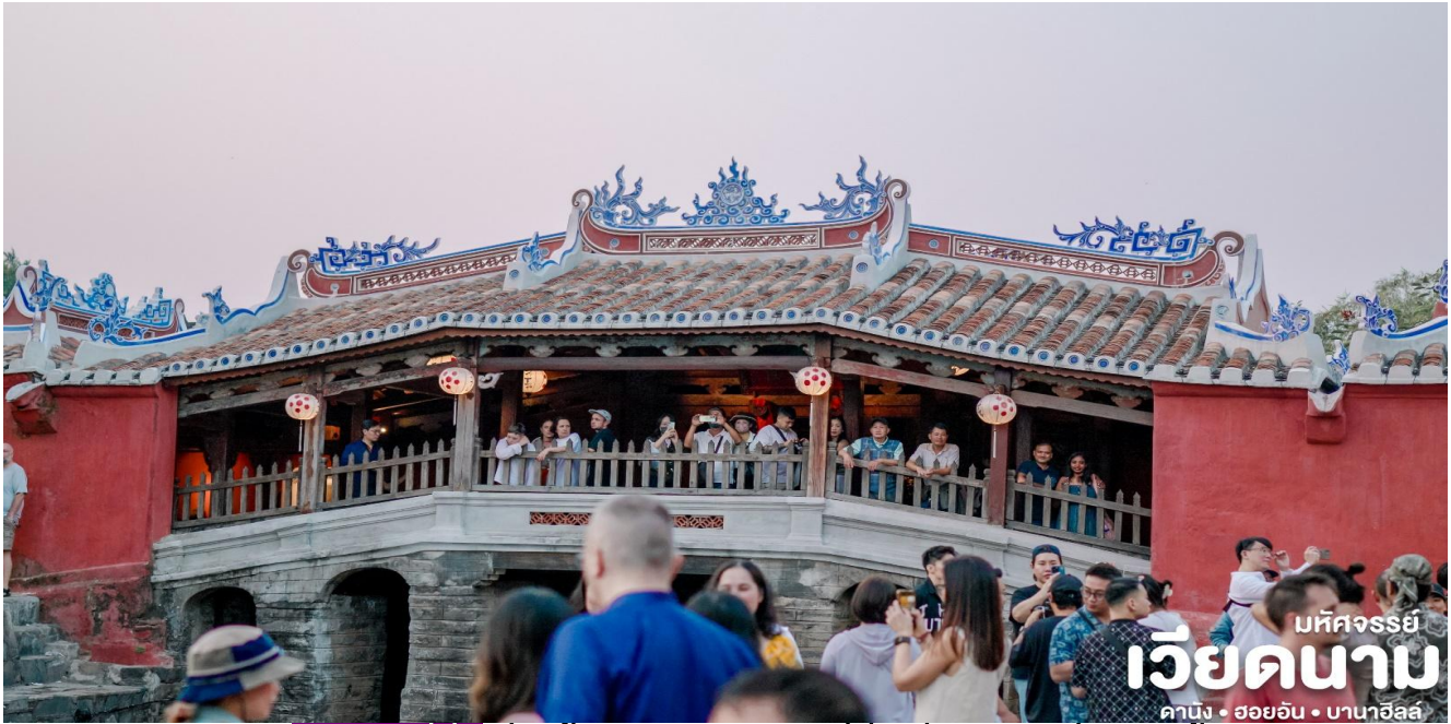
มทศจรรย เวียดนาม ดานัง • ฮอยอัน • บานาฮิลล์

** ชำระค่าทัวร์ในนาม บริษัท นิดน้อย ทราเวล จำกัดเท่านั้น **