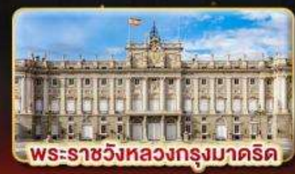
พระราชวังหลวงกรุงมาดริด