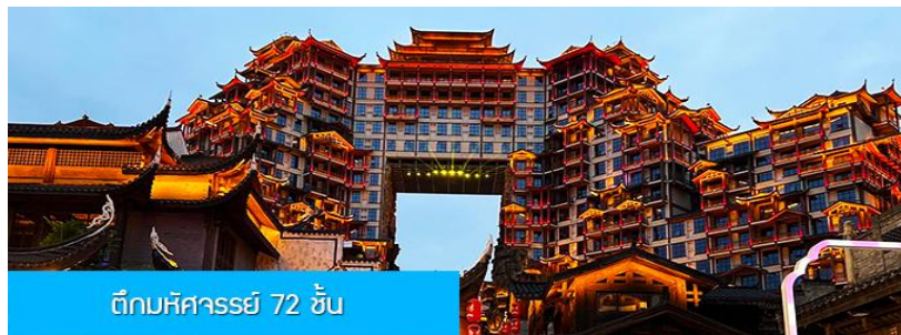
ตึกมหิศวรรษย์ 72 ชั้น

พักที่ HANTING HOTEL ระดับ 4 ดาวท้องถิ่นหรือเทียบเท่าในเมืองจางเจียเจี๋ย