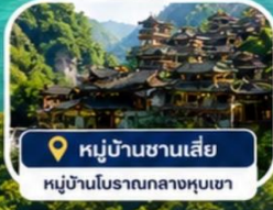
หมู่บ้านซานเสี