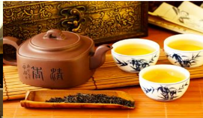
ศูนย์จำหน่ายผลิตใบชา