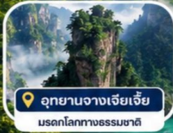
อุทยานจางเจียเจีย