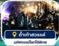
ถ้ำเก้าสวรรค์