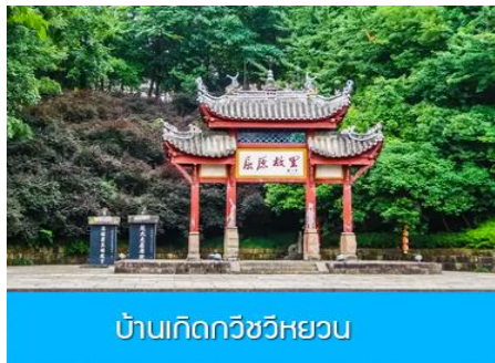
บ้านเกิดกวีชวีหยวน

** ชำระค่าทัวร์ในนาม บริษัท นิดน้อย ทราเวล จำกัดเท่านั้น **