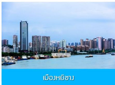
เมืองฮัยซาง

** ชำระค่าทัวร์ในนาม บริษัท นิดน้อย ทราเวล จำกัดเท่านั้น **