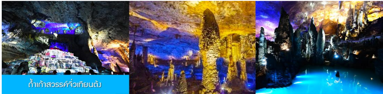
ง้ำเก้าสวรรค์จิวเทียนตั้ง

** ชำระค่าทัวร์ในนาม บริษัท นิดน้อย ทราเวล จำกัดเท่านั้น **