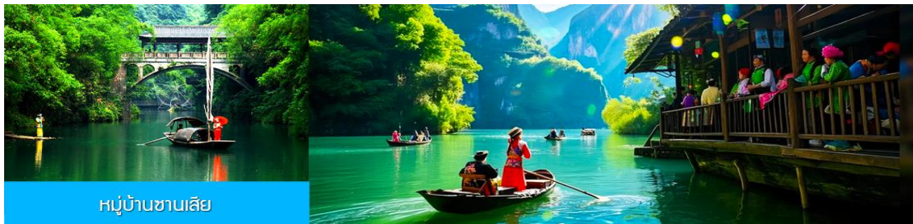
หมู่บ้านชานเสี๋ย

พักที่ YICHANG HUIHAO HOTEL โรงแรมระดับ 4 ดาวหรือเทียบเท่าในเมืองหยี่ชาง