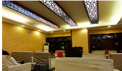
ศูนย์แพคเกจจีน

พักที่ HANTING HOTEL ระดับ 4 ดาวท้องถิ่นหรือเทียบเท่าในเมืองจางเจียเจีย