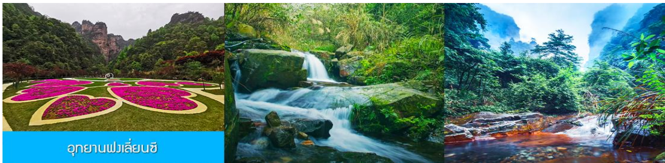
อุทยานฟงเลี่ยนซี