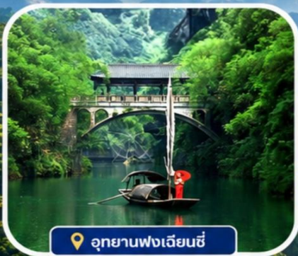
อุทยานฟงเจียนซี

อุทยานฟงเจียนซี | ถ้ำเก้าสวรรค์ | หมู่บ้านซานเสี เมืองโบราณฝูหลงเจิน | ชิมอาหารเมนูพิเศษ บุปเฟ่ต์หมูย่างเกาหลี