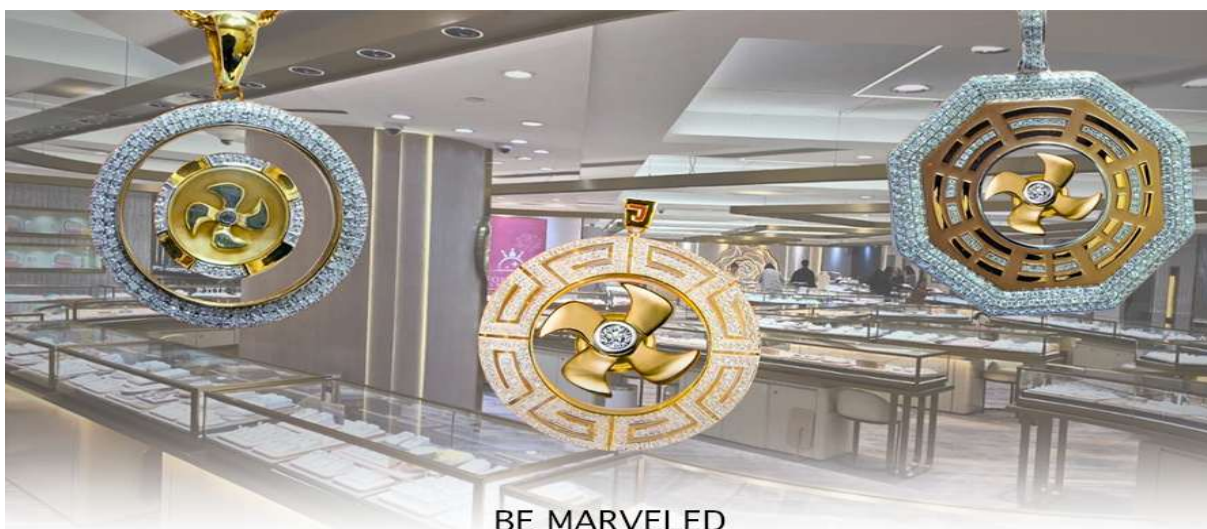
BE MARVELED ศูนย์อวงจ้อย กังหันเศรษฐี

นำท่านชม ศูนย์อวงจ้อย กังหันเศรษฐี ที่ขึ้นชื่อของฮ่องกง ท่านจะได้พบกับงานดีไซน์ที่ได้รับรางวัลยอดเยี่ยม และใช้ใน การเสริมดวงเรื่องอวงจ้อย ศูนย์อวงจ้อยกังหันเศรษฐี วัดแขก" ไม่ใช่ชื่อวัดโดยตรง แต่เป็นชื่อที่เกี่ยวข้องกับ วัดแขกหมิว (Che Kung Temple) ในฮ่องกง ซึ่งเป็นที่รู้จักกันดีในเรื่อง กังหันนำโชค ที่เชื่อว่าสามารถหมุนปิดเป่าสิ่งชั่วร้ายและนำโชคลากเข้ามาในชีวิต และนำท่าน ชม ศูนย์ปี่เซียะ ซึ่งคนจีนนั้น ถือว่าหยกเป็นหิน ที่เป็นตัวแทนของความสวยงามและความบริสุทธิ์มีความเชื่อว่าหยก มงคล ถ้าพกติดตัวไว้จะอายุยืนและสุขภาพดีมีสินค้ำมากมายเกี่ยวกับหยก อาทิ กำไลหยก หรือสัตว์นำโชคอย่างปี่เซียะ ให้ท่านได้เลือกซื้อเป็นของฝาก, ของที่ระลึก หรือของนำโชคแต่ตัวท่านเอง