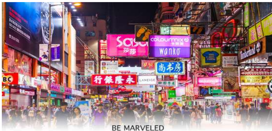
BE MARVELED TSIM SHA TSUI

จากนั้นนำท่าน ช้อปปิ้ง ย่านจิมซาจุ่ย เป็นแหล่งช้อปปิ้งชื่อดัง มีร้านขายของทั้งเครื่องหนัง, เครื่องกีฬา, เครื่องใช้ไฟฟ้า, กล้องถ่ายรูป, อุปกรณ์อิเล็กทรอนิกส์และสินค้าแบบที่เป็นของพื้นเมืองฮ่องกงอยู่ด้วย อีกทั้งสินค้าแบรนด์เนม รวมถึงร้านอาหาร ตั้งอยู่บนถนนนาธาน ถนนทอดยาวตั้งแต่จิมซาจุ่ย จนถึงย่านปรีนซ์เอ็ดเวิร์ด เต็มไป ด้วยร้านค้าต่างๆมากมาย ทั้งเสื้อผ้าแบรนด์เนมระดับ HI-END ชื่อดังทั่วโลก ห้างสรรพสินค้าที่ทันสมัย จากถนน นาธาน ไปที่ถนนแคนตัน ท่านจะตื่นตาตื่นใจไปกับเอาต์เล็ตแบรนด์ที่เรียงติดกันเป็นแถบ นอกจากนี้ยังมี HARBOUR CITY ศูนย์การค้ายักษ์ใหญ่ของฮ่องกง ซึ่งมีร้านค้ากว่า 450 ร้านรวมอยู่ที่นี้ และมี SHOPPING COMPLEX ขนาดใหญ่ชื่อ OCEAN TERMINAL ซึ่งประกอบไปด้วย ห้างสรรพสินค้าเรียงรายกันอยู่ และมีทางเชื่อม ติดต่อกันสามารถเดินทะลุถึงกันได้ มีสินค้าแบรนด์ดัง ไม่ว่าจะเป็น GIORDANO, BOSSINI, COACH, LONGCHAMP, LOUIS VUITTON, PRADA, HEMES และอีกมากมายให้ท่านได้เลือกซื้อ