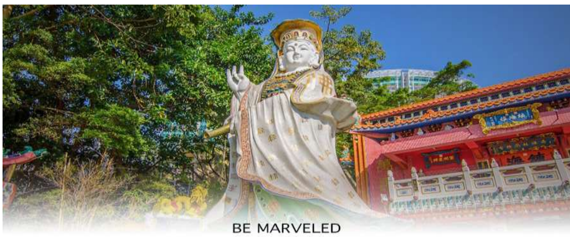
BE MARVELED วัดเจ้าแม่กวนอิมรีพัลส์เบย์

นำทุกท่านเดินทางสู่ ชายหาดรีพัลส์ เบย์ (REPULSE BAY) หาดรีพัลส์เบย์ที่ทอดยาวถึง 292 เมตร ขึ้นชื่อว่ามีทรายสีขาวนุ่มละเอียด น้ำใส สงบ และน่าลงเล่นน้ำทะเลอย่างยิ่ง อันที่จริง ชายหาดอันงามของรีพัลส์เบย์เป็นชายหาดหลักสำหรับลงเล่นน้ำของเกาะฮ่องกงตั้งแต่ศตวรรษที่19 โดยมีบริการรถโดยสารสาธารณะแห่งแรกของเกาะเพื่อรองรับทั้งผู้ที่ชื่นชอบการว่ายน้ำและผู้ที่ชื่นชอบชายหาดหลังจากนั้นนำทุกท่านเข้าชม ศาลเจ้าแม่กวนอิม ตั้งอยู่ทางทิศตะวันออกเฉียงใต้ของรีพัลส์เบย์ที่มองเห็นทะเล ศาลเจ้าของเทพสององค์คือ เจ้าแม่กวนอิม เทพธิดาแห่งความเมตตา และเจ้าแม่กวนฮั่ว เทพธิดาแห่งท้องทะเล ซึ่งคอยคุ้มครองและเป็นที่ยึดเหนี่ยวจิตใจของผู้มาสักการะ แม้จะมีขนาดใหญ่โตกว่า แต่บรรดารูปปั้นอื่นที่น่าสนใจภายในบริเวณวัดลัทธิเต๋าแห่งนี้มันตรงตาตรงใจที่สุด รูปปั้นเหล่านี้รวมถึงรูปปั้นเทพสามตัววันเบิกฟ้าที่แทนความเจริญรุ่งเรือง และ "เทพเจ้าแห่งความสูงผู้ศักดิ์สิทธิ์ด้านความรักและการแต่งงาน "ซึ่งคู่รักมักนำเชือกสีแดงที่มีชื่อของตนเองติดอยู่พันรอบรูปปั้นเพื่ออธิษฐานให้ชีวิต "มีความสุขตลอดไป"