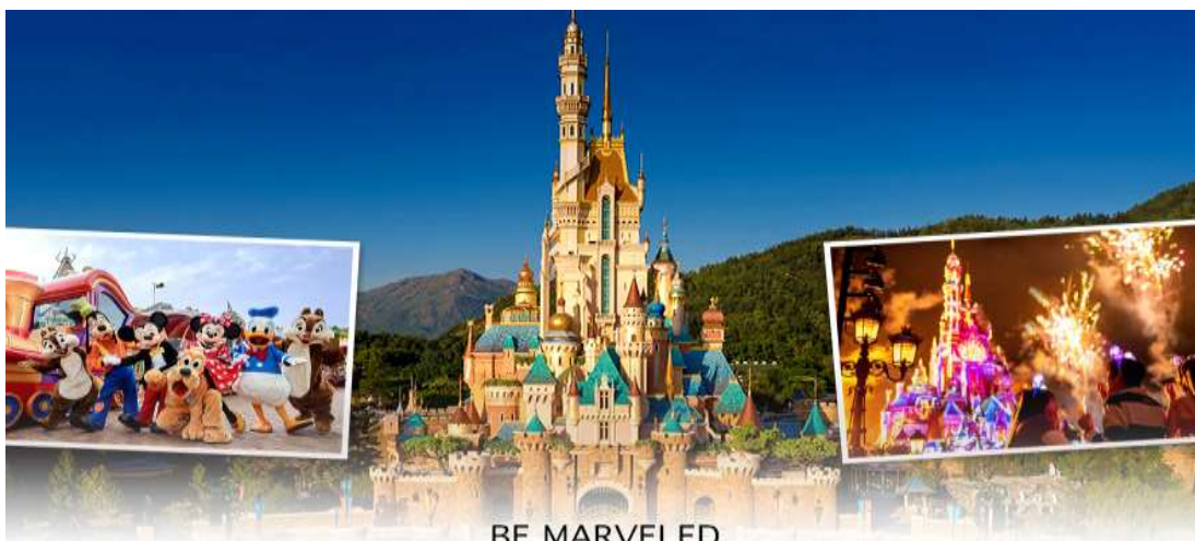
BE MARVELED HONG KONG DISNEYLAND

** ชำระค่าทัวร์ในนาม บริษัท นิดน้อย ทราเวล จำกัดเท่านั้น **