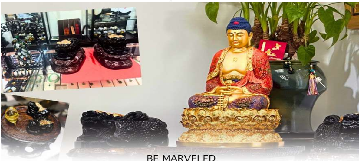
BE MARVELED ศูนย์ปี่เซียะ

** ชำระค่าทัวร์ในนาม บริษัท นิดน้อย ทราเวล จำกัดเท่านั้น **