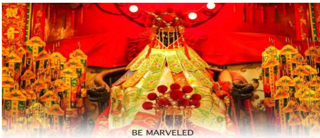
BE MARVELED วัดเจ้าแม่กวนอิมสองฮ่า (ฮิมเงิน)

** ชำระค่าทัวร์ในนาม บริษัท นิดน้อย ทราเวล จำกัดเท่านั้น **