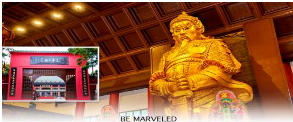
BE MARVELED วัดแชกง

นำท่านเดินทางสู่ วัดแชกงหมิว หรืออีกชื่อหนึ่งว่า “วัดกังหันลม” โดยมีสัญลักษณ์เป็นกังหันนำโชค สร้างขึ้น เพื่อรำลึกถึงท่านแชกงองค์เก่าแก่ มีอายุกว่า 300 ปี ตั้งอยู่ในเขต SHATIN ให้ท่านได้จุดธูปขอพร สักการะ เทพเจ้า แชกง เป็นอีกหนึ่งวัดที่มีประวัติศาสตร์อันยาวนาน มีตามตำนานเล่ากันว่าได้มีโจรสลัดต้องการที่จะมาปล้นชาวบ้าน เมื่อนายพลแชกงรู้เข้าก็ได้บอกให้ชาวบ้านพบบึงกังหันลมแล้วนำไปติดไว้ที่หน้าบ้าน ปรากฏว่าโจรสลัดได้จากไปและไม่ได้ทำการปล้น ชาวบ้านจึงมีความเชื่อว่ากังหันลมนั้นช่วยขจัดสิ่งชั่วร้ายที่กำลังจะเข้ามา และนำพาสิ่งดีๆ มาสู่ตน จึงได้ สร้างวัดแชกงแห่งนี้ขึ้น เพื่อระลึกถึงนายพลแชกง และเป็นที่สักการะบูชาเพื่อไม่ให้มีสิ่งไม่ดีเกิดขึ้น โดยจะมีวิธีการไหว้ คือ ตั้งจิตอธิษฐานด้านหน้าองค์เจ้าพ่อแชกง จากนั้นให้ท่านหมุนกังหัน จะมีกังหัน 4 ใบพัด แต่ละใบหมายถึงพร 4 ประการ คือ เดินทางปลอดภัย, สุขภาพแข็งแรง, สมความปรารถนา, และโชคลาภเงินทอง เชื่อกันว่าหากหมุนครบ 3 รอบและตักลง 3 ครั้ง ถือว่าเป็นการช่วยหมุนปัดเป่าเอาสิ่งร้ายและไม่ดีออกไปให้หมด และนำพาสิ่งดีๆ เข้ามาแทน