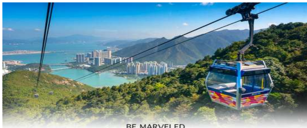
BE MARVELED กระเช้าองปิง

ที่ตั้งตระหง่านอยู่บนยอดเขาเมุกเย่ (MUK YUE) อาณาบริเวณของวัดโปหลิน เป็นพระพุทธรูปทองสัมฤทธิ์กลางแจ้งที่ใหญ่ที่สุดในโลก มีความสูง 26.4 เมตร หากรวมฐานดอกบัวแล้วจะสูงถึง 34 เมตร องค์พระทำขึ้นจากการเชื่อมแผ่นทองสัมฤทธิ์กว่า 200 แผ่นเข้าด้วยกัน น้ำหนักรวม 250 ตัน หันพระพักตร์ไปทางด้านทะเลจีนใต้ และมองอย่างสงบลงมายังหุบเขาและโอดหินเบื้องล่าง ซึ่งการเดินทางไปสักการะองค์พระใหญ่อ่างงไถ่ชิตันนั้น ต้องเดินขึ้นบันได จำนวน 268 ขั้นและได้รับเลือกให้เป็นสิ่งมหัศจรรย์ทางวิศวกรรมขั้นที่ 4 จากทั้งหมด 10 ชั้นของฮ่องกงในปี ค.ศ. 2000 ถือเป็นพระพุทธรูปองค์ใหญ่ที่เป็นสุดยอดของประติมากรรมทางพุทธศาสนาที่มีการผสมผสานระหว่างศิลปะสำริดแบบดั้งเดิมกับเทคโนโลยีสมัยใหม่ ชาวฮ่องกงเชื่อว่า หากใครได้มานับสการขอพรองค์พระใหญ่แห่งนี้แล้ว ชีวิตก็จะมีแต่ความโชคดี มีความสุขสมหวัง และประสบความสำเร็จในทุกๆด้าน หลังจากไหว้พระแล้วท่านสามารถเลือกซื้อของฝาก, ของที่ระลึก จากหมู่บ้านนองปิง อาทิเช่น หยก ไข่มุก หรือเครื่องประดับคริสตัล เพื่อเป็นของที่ระลึก จากนั้นนั่งกระเช้ากลับลงมายังสถานีตงซุง