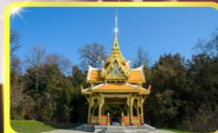
ศาลาไทยไชยานันท์