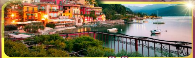
ทะเลสาบโลเซิร์น