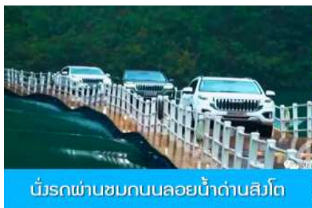
นั่งรถผ่านชมถนนลอยน้ำด่านสิงโต