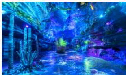
ป่าหิน สั่วปู้ย่า

** ชำระค่าทัวร์ในนาม บริษัท นิดน้อย ทราเวล จำกัดเท่านั้น **