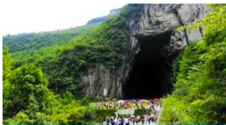
ถ้ำพญามังกร

** ชำระค่าทัวร์ในนาม บริษัท นิดน้อย ทราเวล จำกัดเท่านั้น **