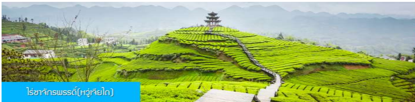
โรซาจักรพรรดิ(หู่เจียโก)

เช้า รับประทานอาหารเช้า ณ ห้องอาหารของโรงแรม (4)