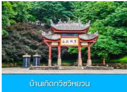
บ้านเกิดกวีชวีหยวน

พักที่ XIAZHOU HOTEL OR HONGQIAO HOTEL ระดับ 4 ดาวท้องถิ่นหรือเทียบเท่า ในเมืองหยีซาง