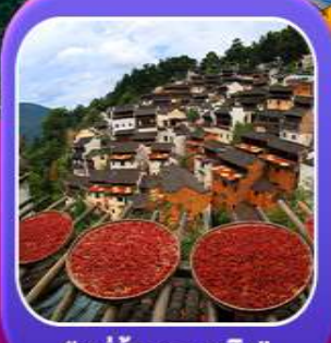
“หมู่บ้านหลงหลิง”

หุบเขาทวดดาวิ้งเซียนถู่ หมู่บ้านที่ตั้งอยู่ริมหน้าผา • หมู่บ้านโบราณหลงหลิง ป่าสนน้ำชิงซาน • ล่องเรือทะเลสาบซีหู • ถนนโบราณตุ่จื่อ • ชมแสงสีที่ อุ๋หนี่โจว