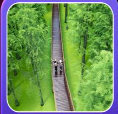
“ป่าสนชิงซาน”