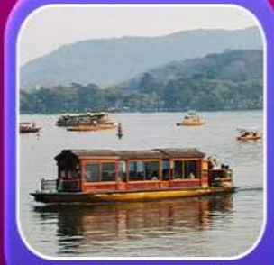
“ล่องเรือทะเลสาบซีหู”