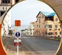
ถนนฮั่วจี้ป่า