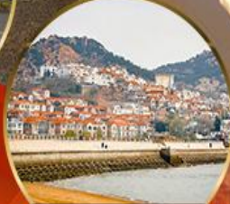
ซาจื่อโป่