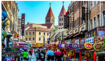
ถนนางซาน