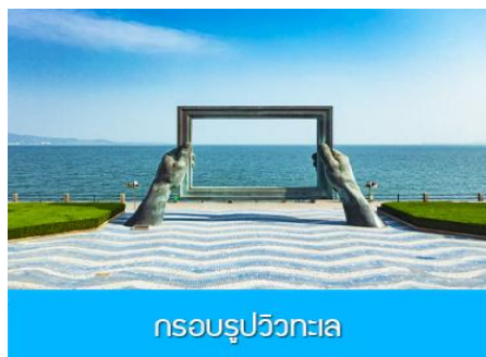
กรอบรูปวิวกทะเล

เช้า รับประทานอาหารเช้า ณ ห้องอาหารของโรงแรม (7)