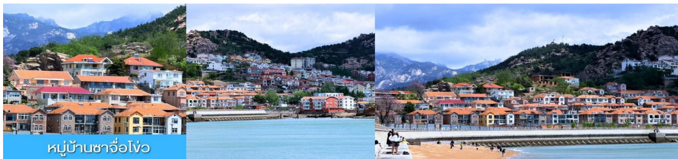
หมู่บ้านซาจื่อโงว

เช้า รับประทานอาหารเช้า ณ ห้องอาหารของโรงแรม (4)