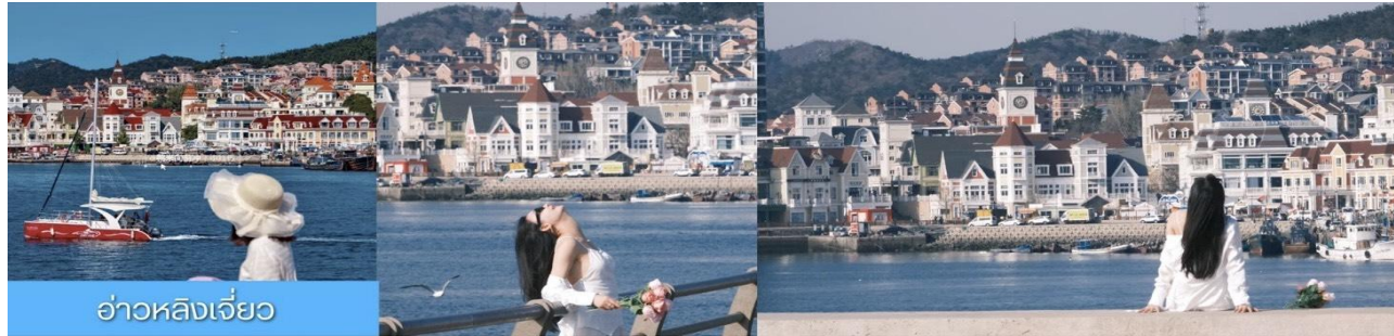
อ่าวหลังเจี้ยว

จากนั้น นำท่านชมจุดไฮไลท์ฝั่ง อ่าวหลังเจี้ยว หลังกลับมาถ่ายรูปกับสี่สีนตึกของท่าเรือผู้ ทาน ที่มีความสวยงามตรง อ่าวหลังเจี้ยว เก็บบรรยากาศภาพความสวยงามแล้วนำท่าน เที่ยวจุดไฮไลท์ถนนตงกวน