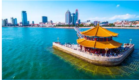
สะพานเจียนเจียว