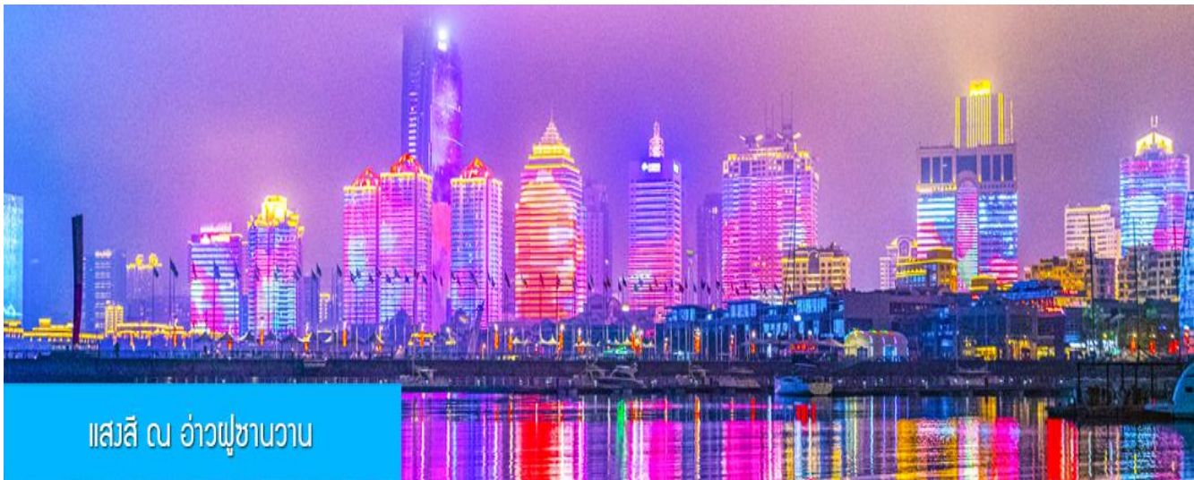
แสงสี ณ อ่าวฟูซานวาน

รับประทานอาหารค่ำ ณ ภัตตาคาร *เมนูซีฟู้ด (3)