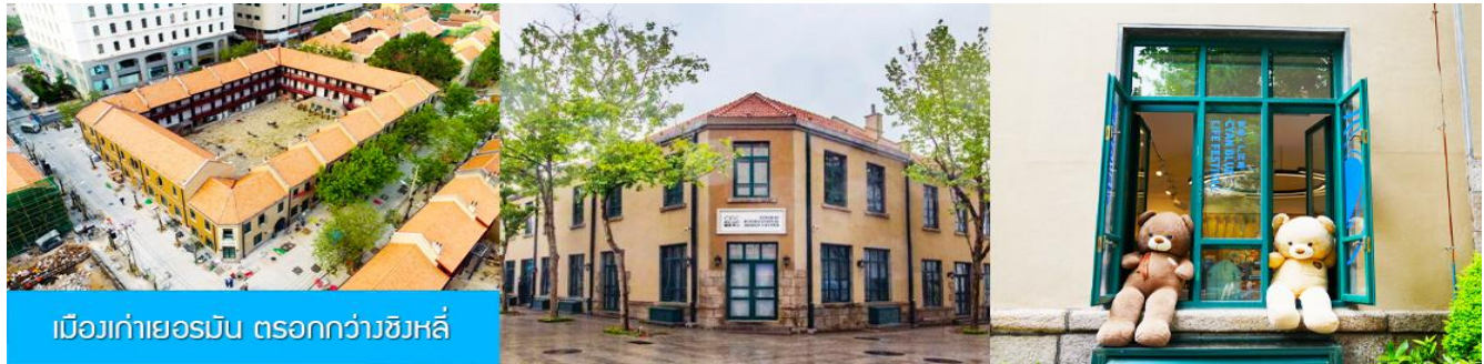
เมืองเก่าเยอรมัน ทรอกกว้างชิงหลี่