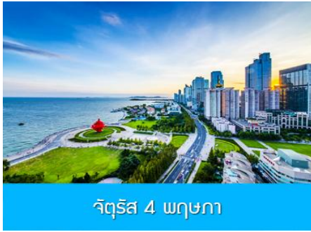
จัตุรัส 4 พฤษภาคม

** ชำระค่าทัวร์ในนาม บริษัท นิดน้อย ทราเวล จำกัดเท่านั้น **