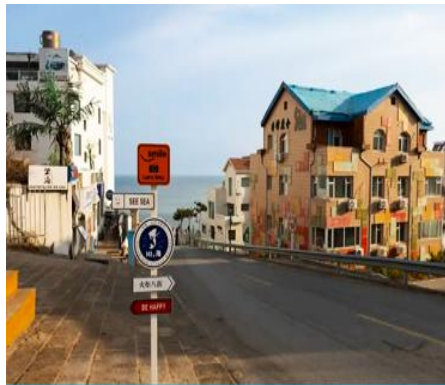
ถนนคบเพลิงหมายเลข 8

** ชำระค่าทัวร์ในนาม บริษัท นิดน้อย ทราเวล จำกัดเท่านั้น **