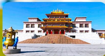
คฤหาสน์พุทธบูชาแห่งชีวิตอุทยาน