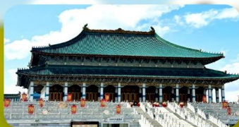
พระราชวังต้งท้ามออร์ดอส