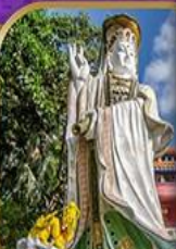
เจ้าแม่กวนอิม สวีลิสเบย์