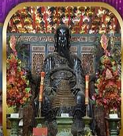
วัดปุกโต