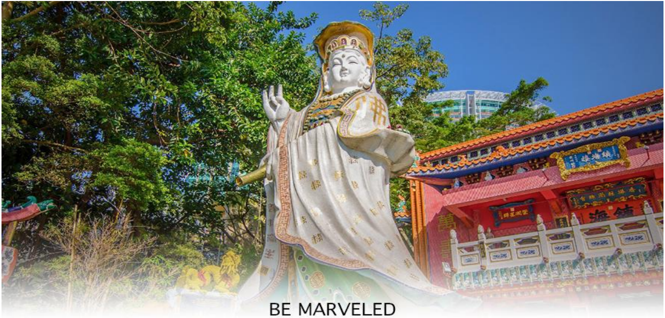
BE MARVELED วัดเจ้าแม่กวนอิมริพัลลิมย์

** ชำระค่าทัวร์ในนาม บริษัท นิดน้อย ทราเวล จำกัดเท่านั้น **