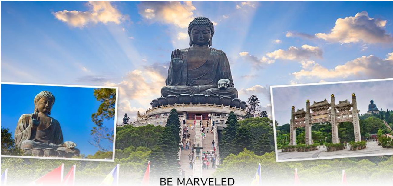
BE MARVELED พระใหญ่เทียนถาน

เปลี่ยนเป็นใช้รถโค้ชของทางอุทยานในการเดินทาง เพื่อนำท่านเข้าสู่หมู่บ้านวัฒนธรรมองปิง บนเกาะ ลันเตาแทน**) จากนั้นนำท่านไปสักการะ (พระใหญ่เกาะลันเตา หรือ พระพุทธรูปเทียนถาน (TIAN TAN BUDDHA STATUE)