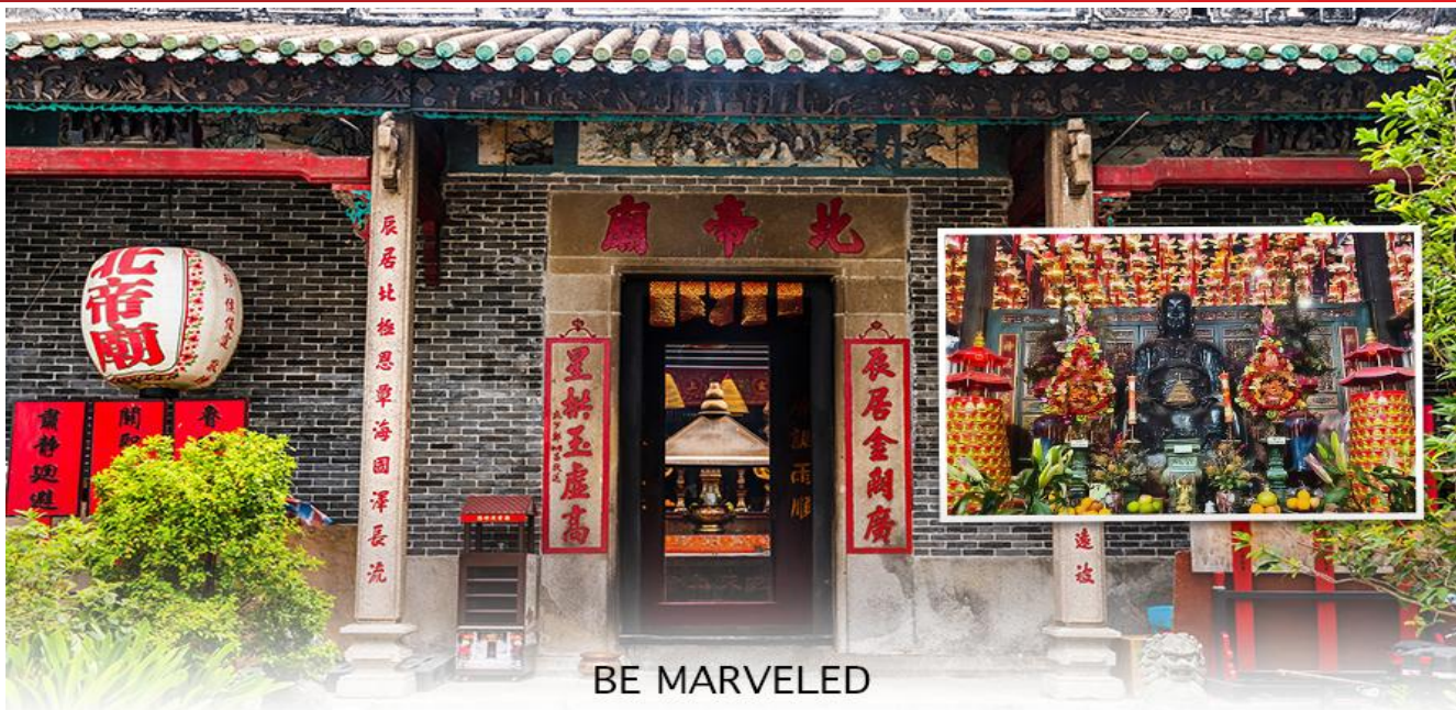
BE MARVELED วัดปักไต้

** ชำระค่าทัวร์ในนาม บริษัท นิดน้อย ทราเวล จำกัดเท่านั้น **