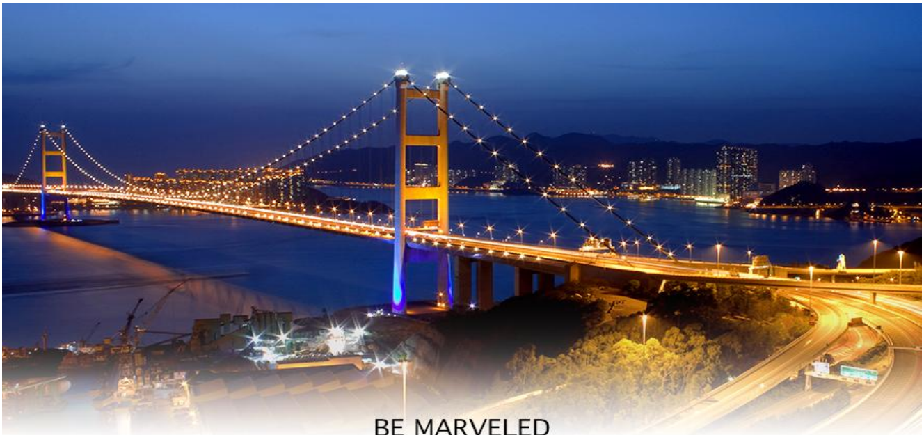
BE MARVELED สะพานแขวนซิงหมา

** ชำระค่าทัวร์ในนาม บริษัท นิดน้อย ทราเวล จำกัดเท่านั้น **