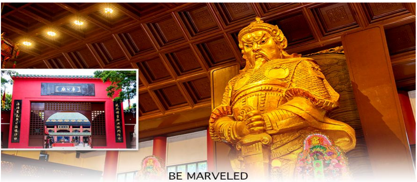
BE MARVELED วัดแขก

นำท่านเดินทางสู่ วัดแขกหมิว หรืออีกชื่อหนึ่งว่า “วัดกังหันลม” หนึ่งในวัดดังของฮ่องกง ที่ประชาชนให้ความเลื่อมใสศรัทธามานาน ด้านในศาลจะมีรูปปั้นสูงใหญ่ของท่านแขก ซึ่งเป็นเทพประจำวัดแห่งนี้ เชื่อ ว่าองค์ท่านศักดิ์สิทธิ์ในการขอพรด้านโชคลาภ เสริมความเป็นสิริมงคล ปัดเป่าเรื่องร้ายๆออกไป และวัดแห่งนี้ยังเป็น สถานที่ที่นิยมสำหรับท่านที่ต้องการแก้ปชงอีกด้วย โดยวิธีการไหว้ขอพรจากท่านแขกนั้น ท่านจะต้องเข้าไปยืนอยู่เบื้อง หน้ารูปปั้นของท่าน แล้วอธิษฐานขอพรพร้อมกับมองหน้าท่านอย่างมุ่งมั่นตั้งใจ จากนั้นให้ท่านทำพิธีหมูน “กังหันแห่งโชคชะตา” หรือ “กังหันนำโชค” เพื่อหมูนรับแต่สิ่งดีๆ ให้เข้ามาในชีวิต