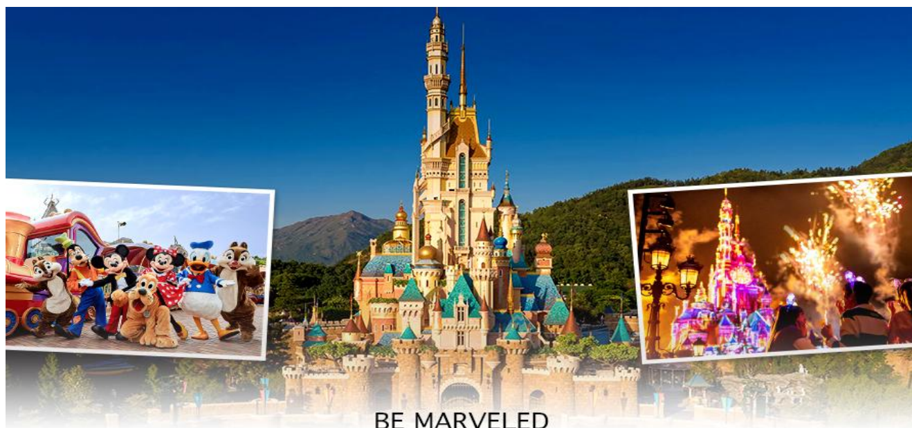
BE MARVELED HONG KONG DISNEYLAND

📍 | อีศระอาหารเที่ยงและอาหารเย็น เพื่อความสะดวกในการช้อปปิ้ง