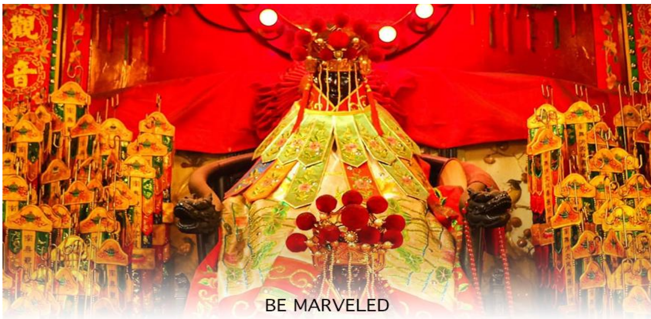
BE MARVELED วัดเจ้าแม่กวนอิมฮองอำ (ยืมเงิน)

หลังจากนั้นนำทุกท่านเดินทางไปยัง วัดเจ้าแม่กวนอิมฮองอำ วัดฮองอำ เป็นหนึ่งในวัดที่เก่าแก่ที่สุดของฮ่องกง และชาวฮ่องกงเลื่อมใสกันมาก สร้างขึ้นในปี ค.ศ.1873 ในสมัยช่วงสงครามโลกครั้งที่ 2 มีการปล่อยระเบิดลงบริเวณใกล้กับวัดแห่งนี้หลายต่อหลายครั้ง ทำให้มีผู้บาดเจ็บและล้มตายนามาย แต่ชาวบ้านที่หนีเข้าไปหลบภัยในวัดนี้ก็กลับปลอดภัยอย่างปาฏิหาริย์ และตัววัดก็ไม่ได้ได้รับความเสียหายจากเหตุการณ์ทิ้งระเบิดที่น่าอัศจรรย์ ตามความเชื่อของคนจีนใน ฮ่องกง-มาเก๊า จะมี "วันเปิดทรัพย์" หรือ "พิธียืมเงิน เจ้าแม่กวนอิมฮองอำ" เป็นวันที่จะมาขอพรและยืมเงินเจ้าแม่กวนอิมซึ่งนับจากหลังวันตรุษจีน ไป 26 วัน จะเป็นวันเปิดทรัพย์ที่จัดขึ้นในทุกๆปี พิธีนี้จะมีเพียงครั้งปีละครั้งเท่านั้น เป็นวันสำคัญอีกวันที่คนหลังไหลมาไหว้ขอพรอย่างไม่ขาดสาย