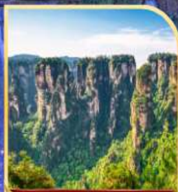
เขาเทียนจ้อซาน