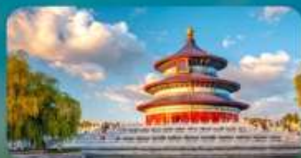
หอสีการะฟ้าเทียนถาน