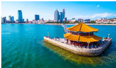
สะพานเจียนเจียว

** ชำระค่าทัวร์ในนาม บริษัท นิดน้อย ทราเวล จำกัดเท่านั้น **