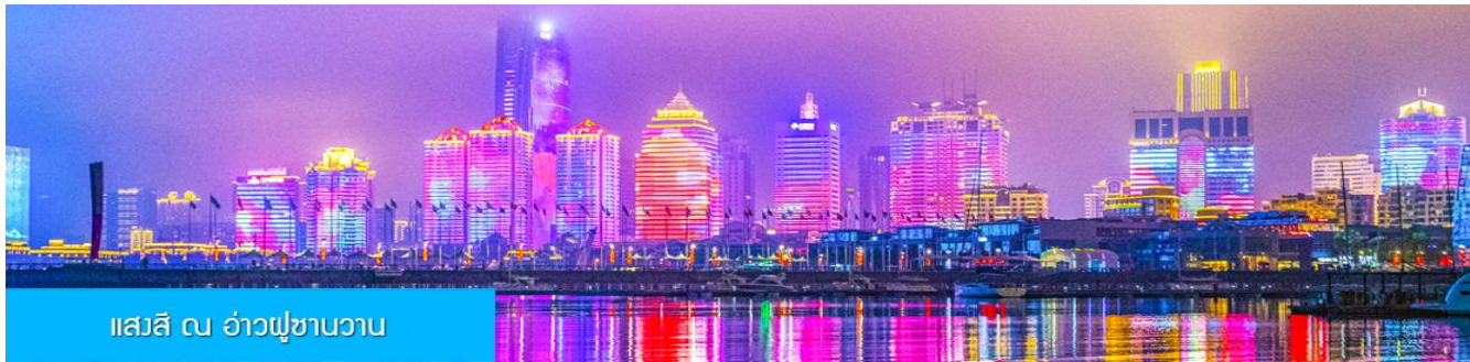
แสงสี ณ อ่าวฝูซานวาน

** ชำระค่าทัวร์ในนาม บริษัท นิดน้อย ทราเวล จำกัดเท่านั้น **