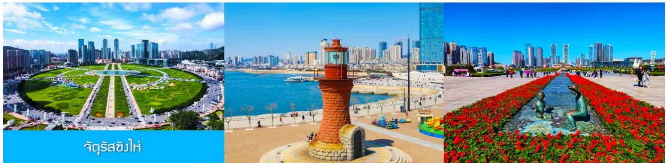
จัตุรัสซิงไห่

จากนั้นนำท่านเที่ยวชมและเก็บภาพ ณ พิพิธภัณฑ์ประวัติศาสตร์หฺลี่ซุ่น 旅顺博物馆 เป็นอาคารพิพิธภัณฑ์เก่าแก่อายุกว่าร้อยปีแห่งแรกที่สร้างขึ้นทางภาคตะวันออกเฉียงเหนือของจีน อาคารพิพิธภัณฑ์มีความโดดเด่นด้วยสถาปัตยกรรมแบบกรีกโรมันยุคเรเนซองส์ ผสมผสานสถาปัตยกรรมแบบตะวันออก ภายในมีการจัดแสดงโบราณวัตถุกว่า 60,000 ชิ้น ท่านสามารถเก็บภาพที่ระลึกด้านหน้าอาคารพิพิธภัณฑ์ และสามารถเข้าชมโบราณวัตถุภายในพิพิธภัณฑ์ได้ตามอรรถาศัย (พิพิธภัณฑ์ปิดทุกวันจันทร์)..