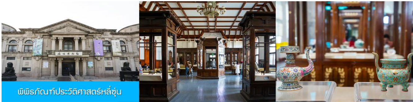
พิพิธภัณฑ์ประวัติศาสตร์หฺลี่ซุ่น

** ชำระค่าทัวร์ในนาม บริษัท นิดน้อย ทราเวล จำกัดเท่านั้น **