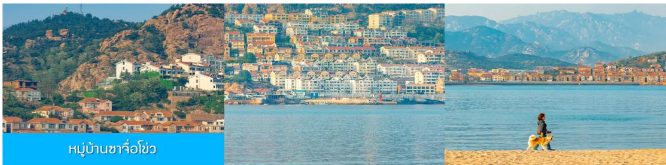
หมู่บ้านซาจื่อโง่ว

เช้า รับประทานอาหารเช้า ณ ห้องอาหารของโรงแรม (4)