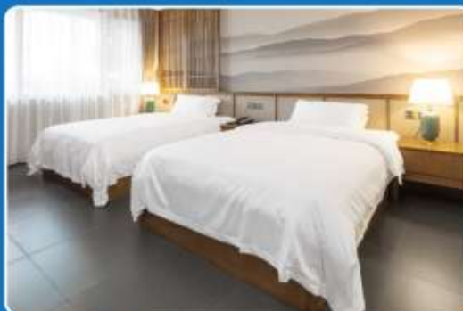
👤👤 TWIN (TWN)