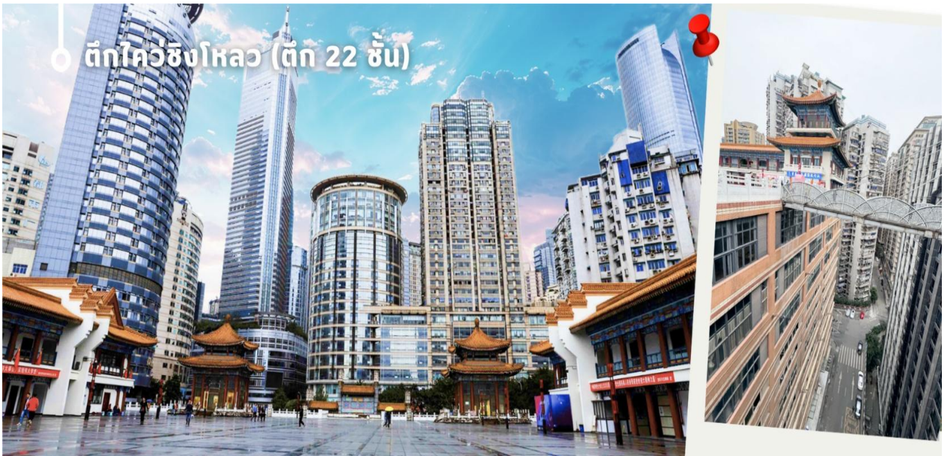
ตึกไควซิงโหลว (ตึก 22 ชั้น)

นำท่านเดินทางไปชมความแปลกใหม่ที่ ตึกไควซิงโหลว (ตึก 22 ชั้น) Kuixinglou ชั้น 1 กลายเป็นชั้นที่ 22 ของอีกฝั่งอาคารเก่าแก่งซึ่งมหัศจรรย์ ยังเป็นสถานที่ถ่ายทำภาพยนตร์เรื่อง "Young You" โดย Yi Yang Qianxi "Kui Xing Tower" อาคารโบราณที่ตั้งอยู่ในเมือง ที่นี้ได้รับการต่อเติมและสร้างใหม่ในปี 1991 สัมผัสความมหัศจรรย์ที่สุดที่นี้ไม่ใช่ตัวอาคาร แต่เป็นสะพานแขวนสองแห่งระหว่างจัตุรัสกับอาคารสำนักงาน สะพานแขวนที่เติมไปด้วยรถกลมเชื่อมระหว่างชั้น 1 ของจัตุรัสกับชั้นบนสุดของชั้น 22 ฝั่งตรงข้ามมองลงมาจกชั้น 1 จะเห็นได้ว่าด้านล่างมี 22 ชั้น เป็นอาคารที่มีลักษณะพิเศษที่เมืองฉงชิ่ง ประเทศจีน เนื่องจากภูมิประเทศที่เป็นภูเขา อาคารแห่งนี้จึงมีทางเข้าในระดับที่ต่างกัน เป็นจุดถ่ายรูปและชมวิถีที่โดดเด่นของเมืองฉงชิ่งที่ได้ชื่อว่าเป็น "เมืองสามมิติ" จากนั้น นำท่านเดินทางสู่ จัตุรัสเวาเทียนเหมิน ซึ่งตั้งอยู่ ณ จุดบรรจบของ แม่น้ำแยงซี และ แม่น้ำเจียหลิง นับเป็นท่าเรือขนส่งทางน้ำที่ใหญ่ที่สุดของนครฉงชิ่ง และเป็นศูนย์กลางการค้าสำคัญมาอย่างยาวนาน บริเวณนี้ยังเป็นที่ตั้งของ ตลาดการค้าครบวงจรเวาเทียนเหมิน ซึ่งถือเป็นตลาดขนาดใหญ่ที่สุดของฉงชิ่ง ทำให้พื้นที่โดยรอบเต็มไปด้วยผู้คนและมีชีวิตชีวาอยู่เสมอ ตั้งแต่อดีตจนถึงปัจจุบัน จัตุรัสแห่งนี้ได้รับการออกแบบให้มีลักษณะคล้ายเรือยักษ์ที่กำลังแล่นออกสู่สายน้ำอย่างสง่างาม จึงได้รับสมญานามว่า "ไททานิคแห่งฉงชิ่ง" เมื่อยืนอยู่บนจัตุรัส ท่านจะสามารถมองเห็นภาพอันน่าประทับใจของจุดบรรจบระหว่างแม่น้ำสองสาย โดยน้ำสีเหลืองของแม่น้ำแยงซีและน้ำสีเขียวมรกตของแม่น้ำเจียหลิงไหลมาบรรจบกันอย่างชัดเจน สร้างทัศนียภาพที่สวยงามและเป็นเอกลักษณ์ของฉงชิ่งอย่างแท้จริง