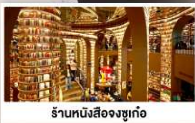
ร้านหนังสือจขุก่อ