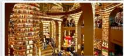
ร้านหนังสือจงซูเก๋

เดินทางโดย: สายการบินเฉิงตูแอร์ไลน์ (EU)