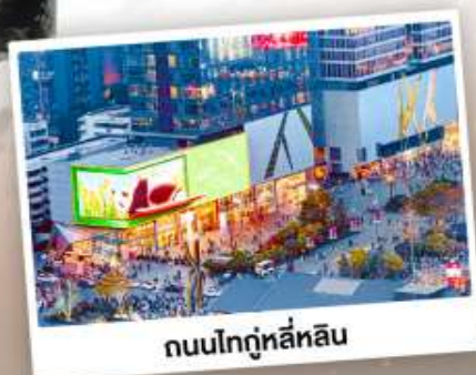
ถนนไท่กู๋หลี่หลิน