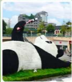
รูปปั้นหมีแพนด้าอนุเชลฟี

ไฮไลท์ ภูเขาสี่ดรุณี (หุบเขาของเจียวโก) เทือกเขาแอลปีแดนมังกร รูปปั้นหมีแพนด้าอนุเชลฟี แลนด์มาร์กสุดฮิตและจุดถ่ายรูปยอดนิยม