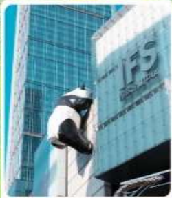
แพนด้ายักษ์มินตึก IFS