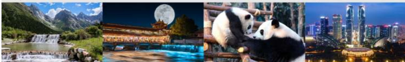
อุทยานแห่งชาติปี้เฟิงโกว