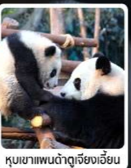
หุบเขาแพนด้าดูเจียงเจี้ยน