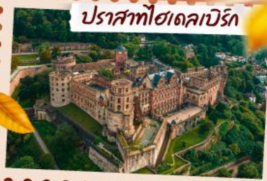
ปราสาทโฆเดคาบิรัก