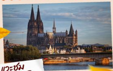
แวะชม มหาวิหารโคโลญ