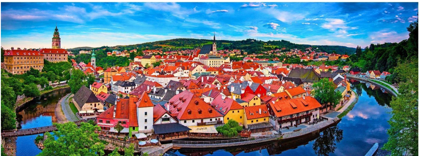
GG35 เซก ออสเตรีย สโลวาเกีย ซังการ์ 8 วัน 5 คืน

เที่ยง รับประทานอาหารกลางวัน ณ ภัตตาคารอาหารพื้นเมือง เมนูปลาเทรียอย่างเกลือ (มื้อที่ 1)