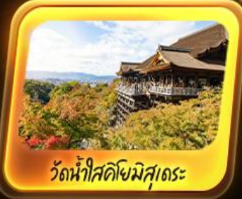
วัดน้ำใสคิซิมิสุเดระ