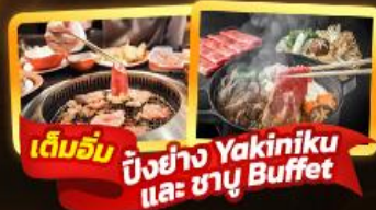
เต็มรับ ปิ้งย่าง Yakiniku และ ชาบู Buffet