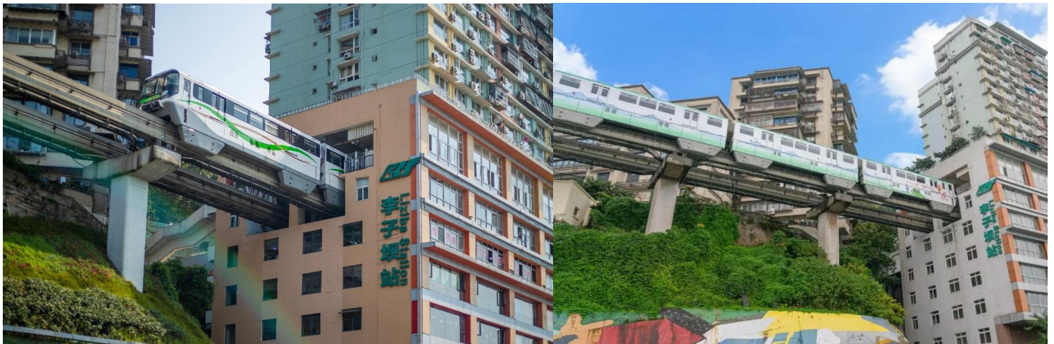
ผ่านสถานีหลี่จื่อป้า (Liziba Station) กะลุ

นำท่านเดินทางสู่ จุดชมวิวยุทธไฟฟ้ากะลุตัก เป็นรถไฟฟ้าสาย2 ของมหานครฉงชิ่ง ที่กำลังวิ่ง