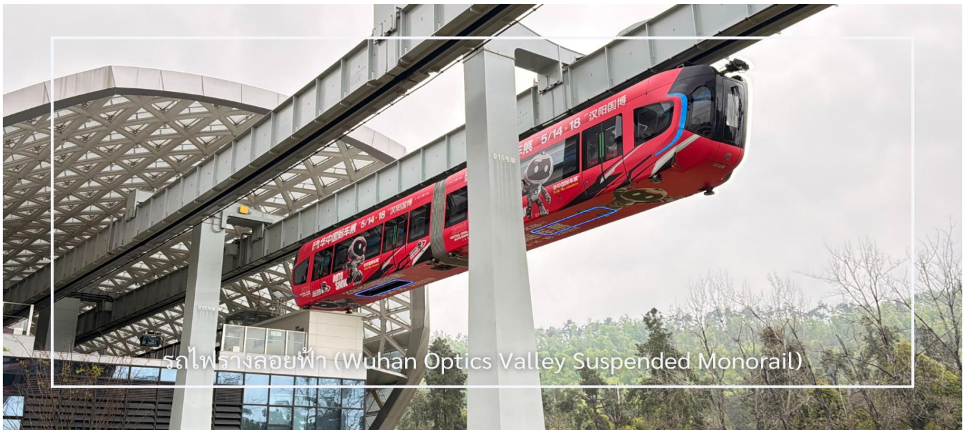
รถไฟรางลอยฟ้า (Wuhan Optics Valley Suspended Monorail)

** ชำระค่าทัวร์ในนาม บริษัท นิดน้อย ทราเวล จำกัดเท่านั้น **