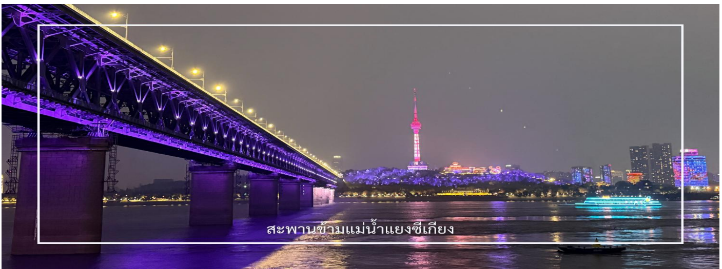
สะพานข้ามแม่น้ำแยงซีเกียง

นำท่านชม สะพานข้ามแม่น้ำแยงซีเกียงแห่งแรกของประเทศจีน (Wuhan Yangtze River Bridge) สะพานสำคัญที่เชื่อมระหว่างฝั่งอันโวก์และอู่ซาง สร้างขึ้นในปี ค.ศ. 1957 และถือเป็นหนึ่งในสัญลักษณ์ของการพัฒนาโครงสร้างพื้นฐานของจีนในยุคใหม่ ตัวสะพานเป็นโครงสร้าง 2 ชั้น สำหรับการสัญจรของรถยนต์และรถไฟ บริเวณนี้ยังเป็นจุดชมวิวกี่สามารถมองเห็นแม่น้ำแยงซีเกียงและทัศนียภาพของเมืองอู่ฮั่นได้อย่างสวยงาม โดยเฉพาะในช่วงค่ำคืนที่แสงไฟของเมืองส่องสะท้อนกับสายน้ำ สร้างบรรยากาศที่น่าประทับใจ