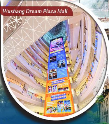
Wushang Dream Plaza Mall

คอนเฟิร์มออกเดินทาง ตั้งแต่ 10 ท่าน ขึ้นไป