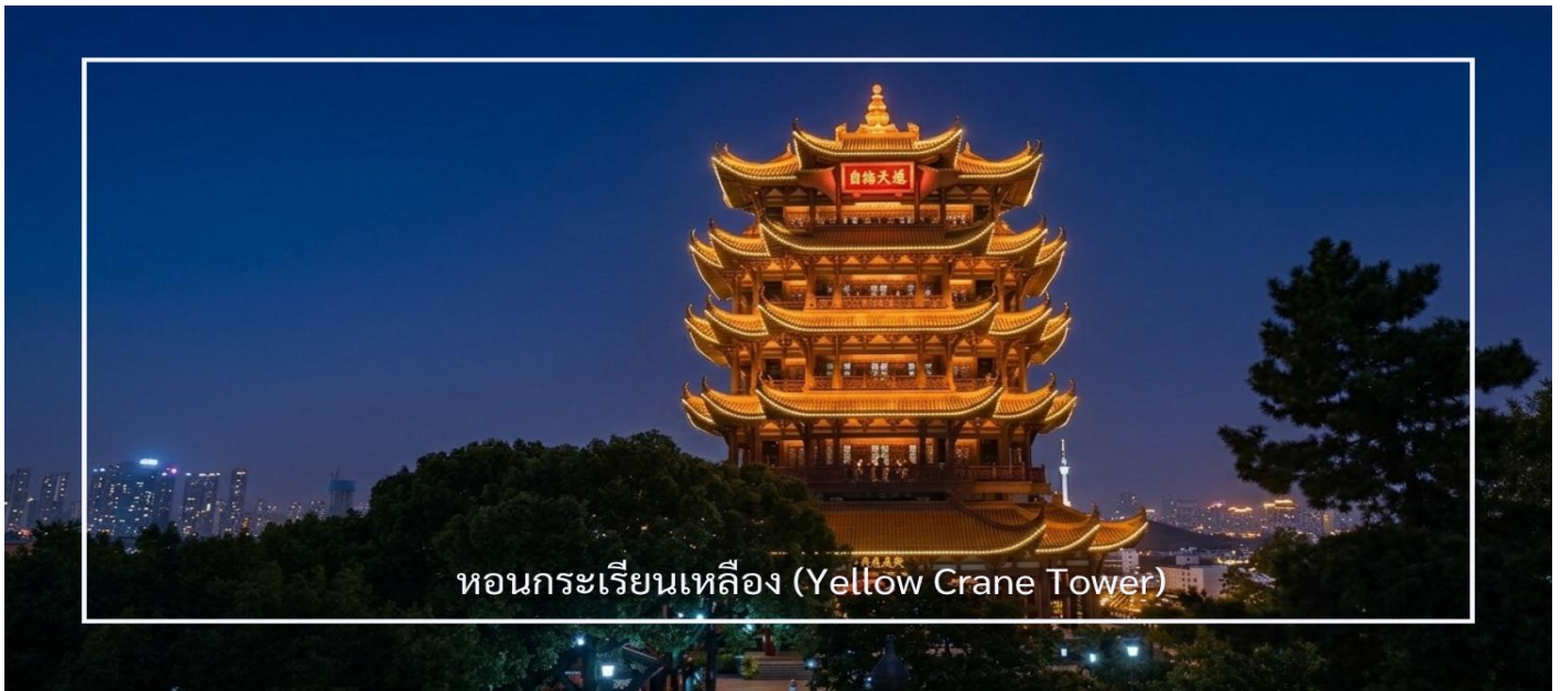
หอนกระเรียนเหลือง (Yellow Crane Tower)

นำท่านชมแสงสียามค่ำคืน หอนกระเรียนเหลือง (Yellow Crane Tower) หนึ่งในสถานที่สำคัญและเป็นสัญลักษณ์ของเมืองอู่ฮั่น เป็นหอคอยโบราณที่มีประวัติศาสตร์ยาวนานกว่า 1,700 ปี ตั้งอยู่ริมฝั่งแม่น้ำแยงซี โดดเด่นด้วยสถาปัตยกรรมจีนโบราณอันงดงามและสง่างาม หอแห่งนี้มีความสำคัญทั้งในด้านประวัติศาสตร์ วัฒนธรรม และวรรณกรรม โดยปรากฏอยู่ในบทกวีจีนโบราณหลายบท และถือเป็นหนึ่งในสี่หอคอยที่มีชื่อเสียงที่สุดของจีน