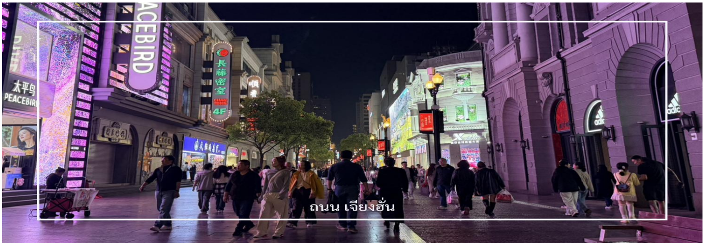
ถนน เจียงอัน

และบริเวณใกล้เคียงนั้น นำท่านเช็คอิน ถนนคนเดินเจียงอันคู่ (Jiangnan Road Pedestrian Street) ย่านการค้าเก่าแก่และคึกคักที่สุดแห่งหนึ่งของเมืองอู่ฮั่น รายล้อมด้วยอาคารสไตล์ยุโรปที่เรียงรายตลอดสองข้างทาง สร้างบรรยากาศคล้ายถนนในยุโรปผสมผสานกับความทันสมัยของเมืองใหญ่ ภายในเต็มไปด้วยร้านค้าแบรนด์ดัง ร้านอาหาร คาเฟ่ และร้านของฝากหลากหลาย รวมถึงร้าน POP MART แบนด์อาร์ตกอยยอดนิยม ให้ท่านได้เลือกซื้อสินค้าและของสะสม ให้ท่านอิสระเดินเล่นและช้อปปิ้ง ตามอัธยาศัย