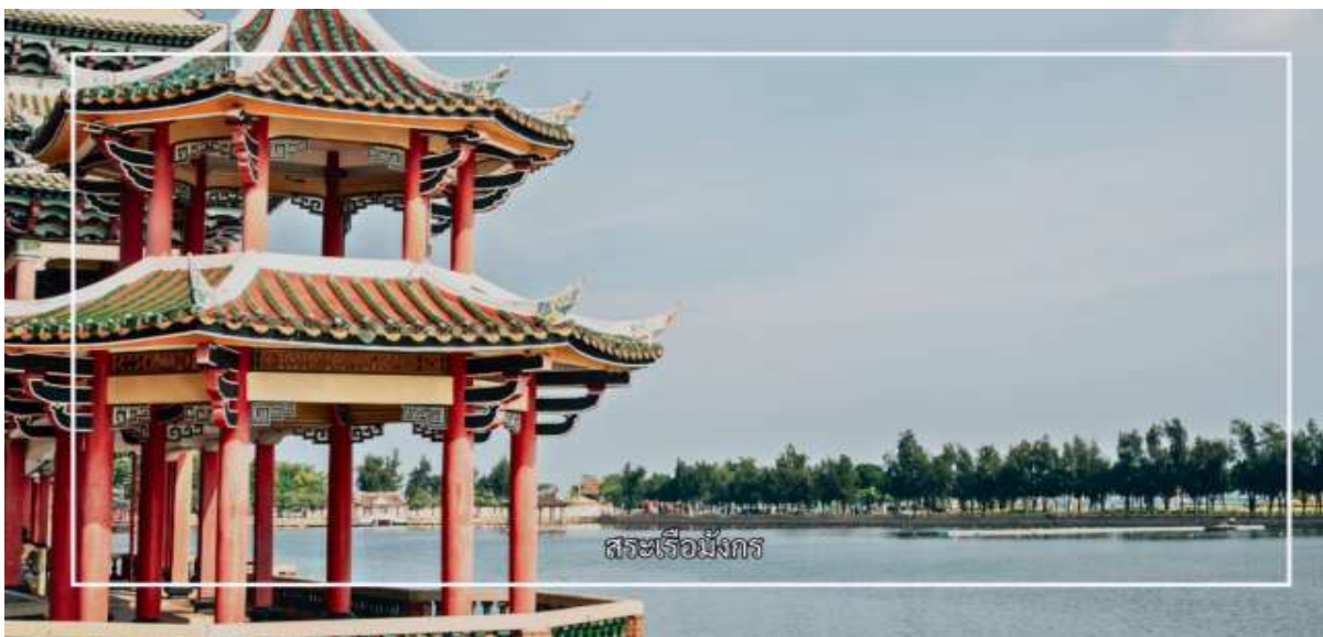
สระเรือมังกร

จากนั้นนำท่านสู่ สระเรือมังกร (Dragon Boat Pond) เป็นแหล่งท่องเที่ยวทางวัฒนธรรมและภูมิทัศน์ที่มีชื่อเสียงของเมือง สระน้ำแห่งนี้สร้างขึ้นโดยมีจุดประสงค์เพื่อใช้จัดการแข่งขันเรือมังกร ซึ่งเป็นประเพณีสำคัญที่สะท้อนรากเหง้าทางวัฒนธรรมของชาวจีน โดยเฉพาะในช่วงเทศกาลตวนอู๋ พื้นที่โดยรอบสระได้รับการออกแบบอย่างงดงาม รายล้อมด้วยอาคารสไตล์จีนดั้งเดิม สะพาน ทางเดิน และสวนสาธารณะ ทำให้เกิดบรรยากาศที่ผสมผสานระหว่างความสงบร่มรื่นและกลิ่นอายทางประวัติศาสตร์ สระเรือมังกรจื๋อเหมยจึงเหมาะแก่การเดินชมทัศนียภาพถ่ายภาพ และเรียนรู้เรื่องราวทางวัฒนธรรมของเมืองซีเหมินอย่างใกล้ชิด