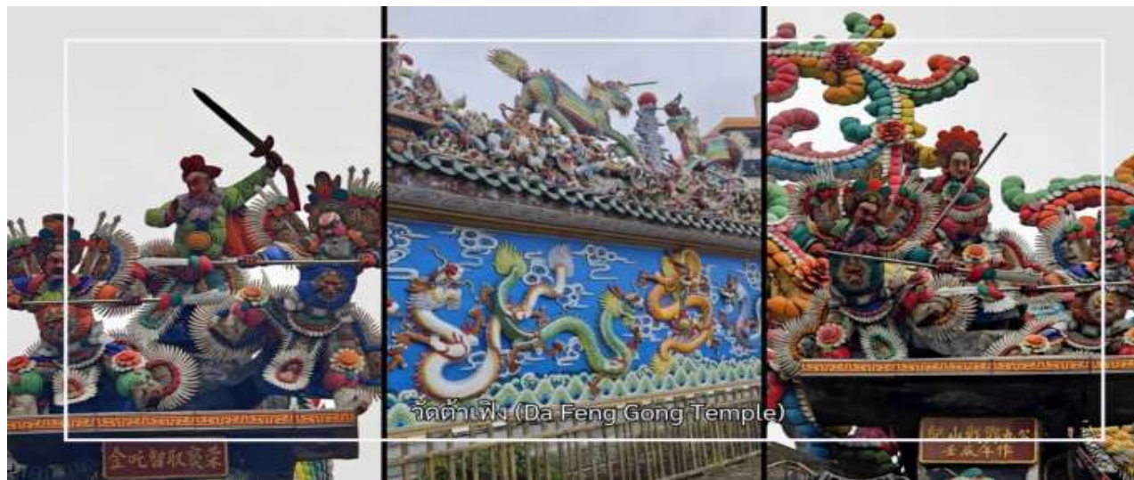
วัดต้าเฟิง (Da Feng Gong Temple)

** ชำระค่าทัวร์ในนาม บริษัท นิดน้อย ทราเวล จำกัดเท่านั้น **