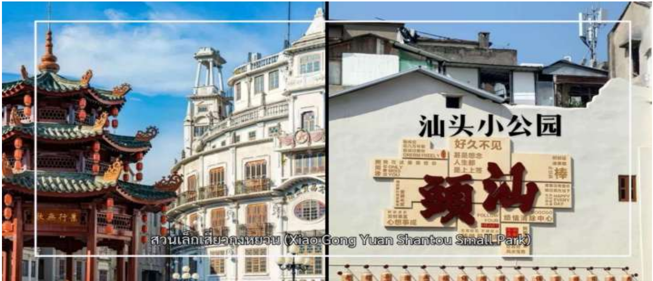
สวนเล็กเสี่ยวกงหยวน (Xiao-Gong Yuan Shantou Small Park)

แวะชม สวนเล็กชวเถา หรือที่รู้จักกันในชื่อ เสี่ยวกงหยวน (Xiao Gong Yuan Shantou Small Park) สถานที่สำคัญทางประวัติศาสตร์และวัฒนธรรมใจกลางเมืองชวเถา ที่สะท้อนถึงพัฒนาการของเมืองในช่วงการเปิดท่าเรือการค้าในอดีต พื้นที่แห่งนี้เคยเป็นศูนย์กลางความเจริญและกิจกรรมทางสังคมของชุมชนมาอย่างยาวนาน บริเวณโดยรอบสวนรายล้อมด้วยอาคารสไตล์จีนผสมตะวันตกอันเป็นเอกลักษณ์ แสดงถึงอิทธิพลทางสถาปัตยกรรมจากการค้าระหว่างประเทศ