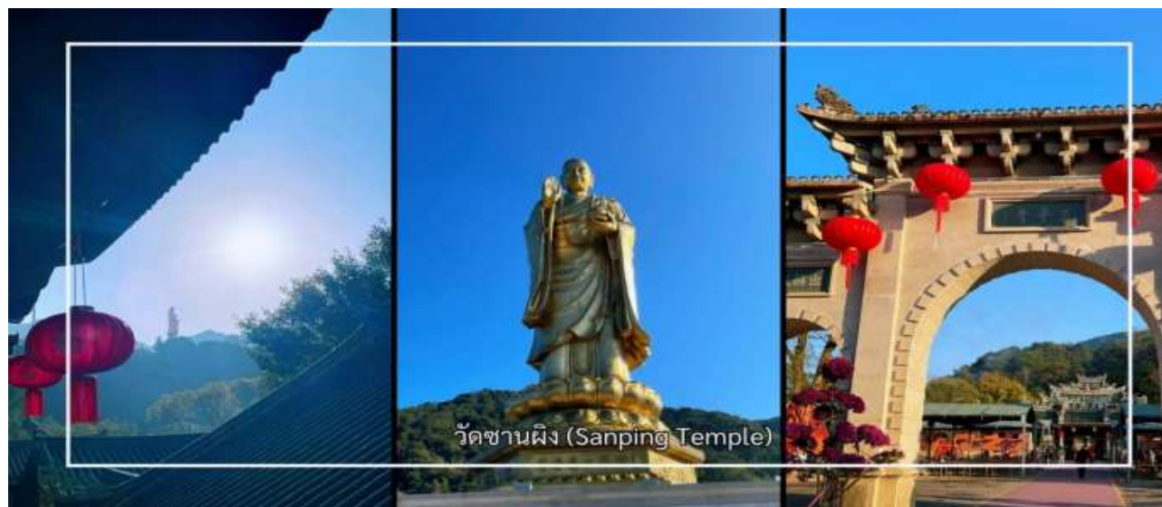
วัดซานผิง (Sanping Temple)

ธรรมชาติและสถาปัตยกรรมจีนดั้งเดิมอันงดงามผู้มาเยือนสามารถสักการะสิ่งศักดิ์สิทธิ์ เรียนรู้ประวัติศาสตร์ความเป็นมาของวัด และสัมผัสถึงความสงบทางจิตใจ