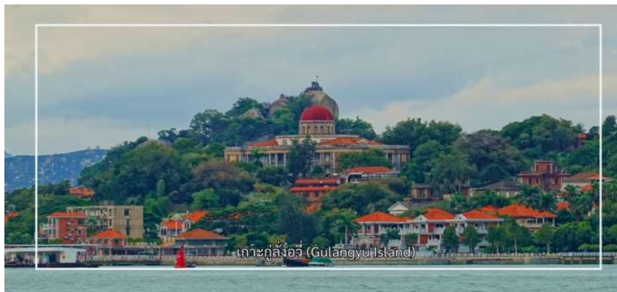
เกาะกู่ลิ่งอวี่ (Gulangyu Island)

สมควรแก่เวลานำท่านเดินทางกลับเซี่ยเหมิน นำท่านสู่ เกาะกู่ลิ่งอวี่ (Gulangyu Island) เกาะเล็กอันมีเสน่ห์ที่มีชื่อเสียงด้านสถาปัตยกรรมอันงดงามที่ผสมผสานระหว่างสไตล์ตะวันตกและจีน สะท้อนถึงประวัติศาสตร์การติดต่อกับชาติ