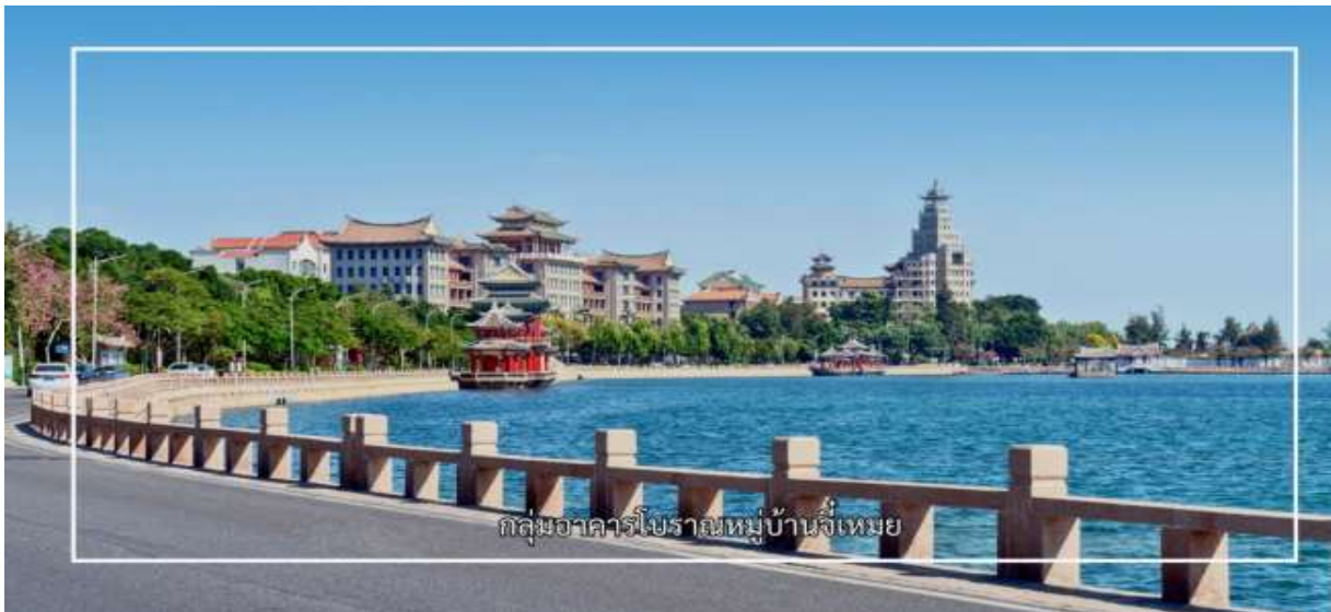
กลุ่มอาคารโบราณหมู่บ้านจื๋อเหมย

** ชำระค่าทัวร์ในนาม บริษัท นิดน้อย ทราเวล จำกัดเท่านั้น **