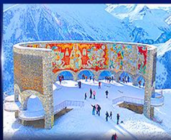
อนุสาวรีย์มิตรภาพ รัสเซีย-จอร์เจีย