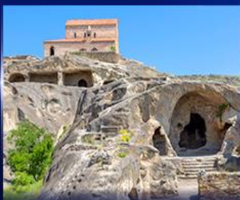
เมืองท่าโบราณ อุปลิสซิค