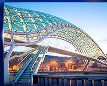
สะพานแห่งสันติภาพ ทบิลีซี

** ชำระค่าทัวร์ในนาม บริษัท นิดน้อย ทราเวล จำกัดเท่านั้น **