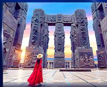
อุทยานประวัติศาสตร์จอร์เจีย