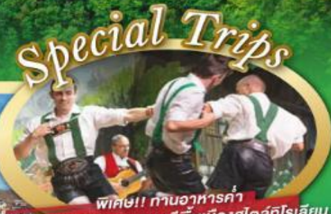
พิเศษ!! งานอาหารค่ำ พร้อมชมการแสดงดนตรีพื้นเมืองสไตล์ไทโรเลียน และเยือนเมืองอูเทรคต์ สีสันใหม่เนเธอร์แลนด์