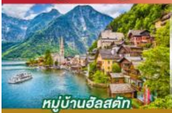
หมู่บ้านอัลสติก