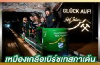
เหมืองเกลือเบิร์ชเทสกาเดิน