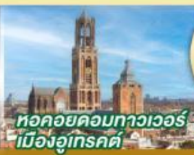
หอคอยคองทาวเวอร์ เมืองอูเทรคต์