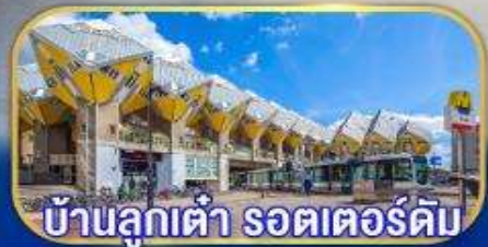
บ้านลูกเต่า รอตเตอร์ดัม

เยือนเมืองเก่าแก่ยุโรป ทั่วมุขไฮไลต์กลุ่มประเทศเบเนลิกซ์ กับการบินไทย บินตรงอัมสเตอร์ดัม