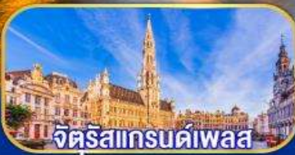
จัตุรัสแกรนด์เพลส