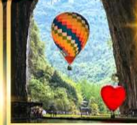
ถ้าถึงหลง