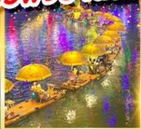
ล่องแพมังกร