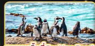
ชมแพนกวิน ที่ Boulders Beach

พิเศษ! พักโรงแรม The Palace of the Lost City สุดหรู 1 คืน