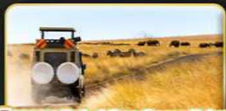
กิจกรรม Safari One Game Drive ชม BIG 5

จุดเริ่มต้นแห่งชีวิต และการเริ่มต้นสำรวจโลก