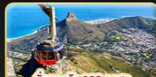
นั่งกระเช้า 360 องศา สู่ Table Mountain