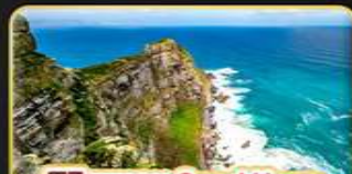
พืชมัทธาม Good Hope