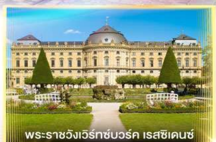
พระราชวังแวร์ซายส์บวร์ค เรสซิเดนซ์