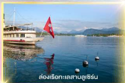
ล่องเรือทะเลสาบลูซิเิร์น