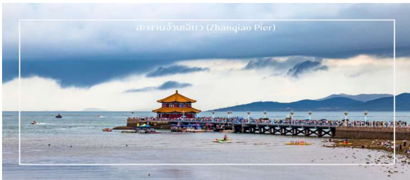
สะพานเจี้ยนเฉียว (Zhanqiao Pier)

นำท่านแวะเช็กอิน สะพานเจี้ยนเฉียว (Zhanqiao Pier) แลนด์มาร์กสำคัญและสัญลักษณ์ของเมืองชิงเต่า สะพานแห่งนี้ทอดยาวสู่ทะเลจากชายฝั่งใจกลางเมือง สร้างขึ้นตั้งแต่สมัยราชวงศ์ชิง มีความยาวประมาณ 440 เมตร เป็นจุดชมวิวกะเอยอดนิยม ท่านสามารถเพลิดเพลินกับบรรยากาศชายทะเล และวิวอ่าวชิงเต่าอันกว้างไกล อีกทั้งยังเป็นจุดถ่ายภาพยอดนิยมที่มองเห็นภาพเมืองชิงเต่าตัดกับท้องฟ้าและผืนน้ำสีฟ้าได้อย่างสวยงาม