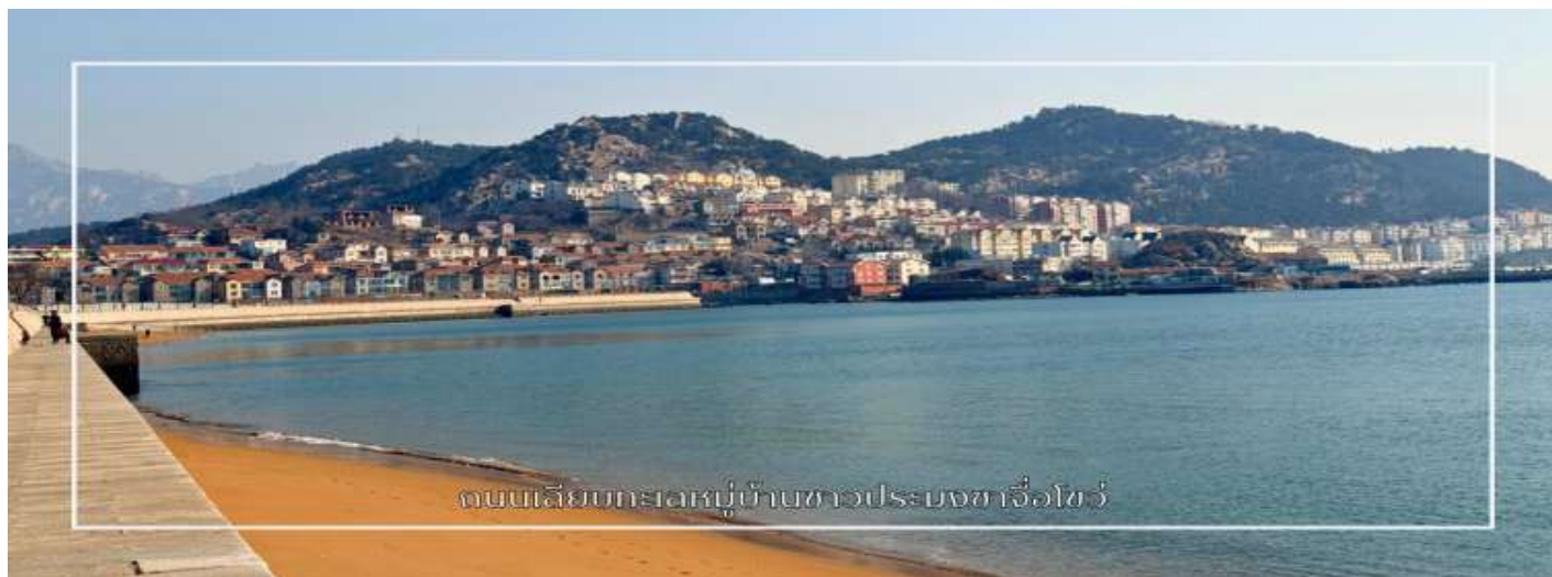
ถนนเลียบริมทะเลหมู่บ้านชาวประมงซาโจวไซว์

นำท่านเยือน โรงเบียร์ชิงเต่า (Tsingtao Brewery) (พิเศษ:ชิมเบียร์ฟรี2แก้ว/ท่าน) สถานที่ก่อตั้งโรงงานเบียร์แห่งแรกของจีน เรียนรู้ประวัติความเป็นมาและกระบวนการพัฒนาตั้งแต่ยุคแรกจนถึงปัจจุบัน ชมกรรมวิธีการกลั่นเบียร์แบบดั้งเดิมและเทคโนโลยีการผลิตสมัยใหม่ที่สุดในโลก พร้อมชม ขบวนการบรรจุเบียร์ลงขวดและกระป๋อง เพื่อจัดจำหน่ายสู่ตลาดโลก และลิ้มรส เบียร์ชิงเต่าที่มีชื่อเสียงระดับโลกอิสระเดินเล่นตามอริยาศัย ถนนเบียร์ชิงเต่า เป็นย่านคึกคักที่เต็มไปด้วยร้านอาหารและบาร์ บรรยากาศสนุกสนาน มีคนมาเดินเล่น ดื่มเบียร์ และกินอาหารทะเลกันตลอด โดยเฉพาะเบียร์ท้องถิ่นของ Tsingtao Brewery ถือเป็นจุดเช็กอินยอดนิยมของเมือง