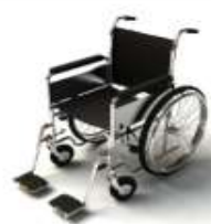
การรับบริการดูแลเป็นพิเศษ

กรณีผู้เดินทางต้องการความช่วยเหลือเป็นพิเศษ อาทิเช่น การใช้วีลแชร์ กรุณาแจ้งบริษัทฯ อย่างน้อย 7 วันก่อนการเดินทาง มิฉะนั้นบริษัทฯ จะไม่สามารถจัดการล่วงหน้าได้ เนื่องจากการขอใช้วีลแชร์ในสนามบินนั้น ต้องมีขั้นตอนในการขอล่วงหน้า และบางสายการบินอาจมีการเรียกเก็บค่าใช้จ่ายทั้งทางสนามบินในไทยและในต่างประเทศ ซึ่งผู้เดินทางสามารถสอบถามกับเจ้าหน้าที่ได้โดยตรงก่อนทำการจอง และหากในขณะของท่านมีผู้ต้องการดูแลพิเศษ เช่น ผู้ที่นั่งรถเข็น (Wheelchair) , เด็ก , ผู้สูงอายุและผู้ที่มีโรคประจำตัวหรือไม่สะดวกในการเดินทางท่องเที่ยวในระยะเวลาเกินกว่า 4 - 5 ชั่วโมงติดต่อกัน ท่านและครอบครัวต้องให้การดูแลสมาชิกภายในครอบครัวของท่านเอง เนื่องจากการเดินทางเป็นหมู่คณะ หัวหน้าทัวร์มีความจำเป็นต้องดูแลคณะทัวร์ทั้งหมด