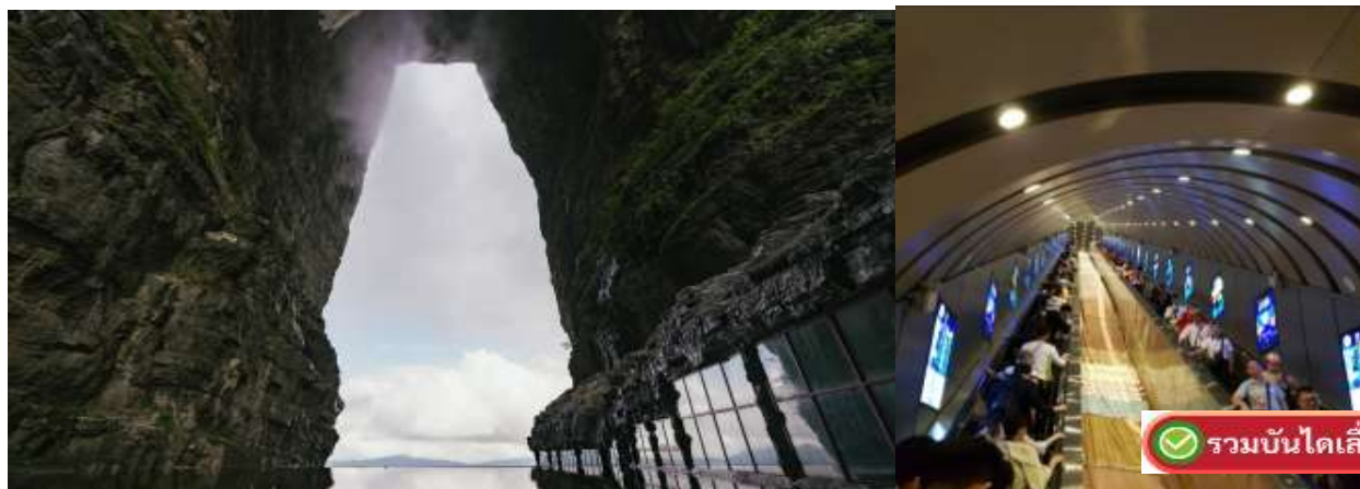
รวมบันไดเลื่อน

จากนั้นนำท่านชมถ้ำเทียนเหมิน หรือ ประตูสวรรค์ (Tianmen Cave) ตั้งอยู่บนภูเขาเทียนเหมินซาน ในเมืองจางเจียเจีย มณฑลหูหนาน ประเทศจีน เป็นช่องเขาหินปูนธรรมชาติที่เกิดจากการพังทลายของหน้าผาในปี ค.ศ. 263 มีความสูง 131.5 เมตร กว้าง 57 เมตร ได้ชื่อว่าเป็น "ซุ้มประตูธรรมชาติที่สูงที่สุดในโลก" และเป็นสถานที่ท่องเที่ยวอันโดดเด่น