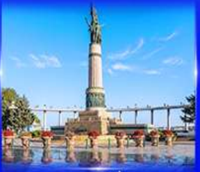
พิพิธภัณฑ์ ติ๊กตาเป่ลุดดัก