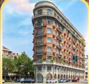
อาคารอู่คัง