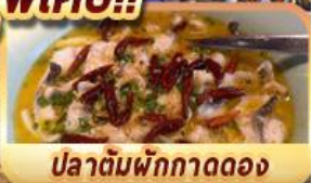
ปลาต้มพริกกาดดอง