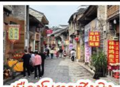
เมืองโบราณเซ็งผิง

เช็คอินจุดไฮไลท์โลกทัยหลิน เจดีย์เงินเจดีย์ทอง ฝางวงซิว นิงเคบัสคาสู๋ เชาหลู้อี จุดชมวิวกะหลูเกา แห่งเมืองหยานซิว ล่องเรือแม่น้ำลี่เจียง ตามรอยช้างหลังภาพพรบมิตร 20 หยวน อีสระช้อปโปงกนคนคนเดิน 2 แห่ง กนตงซีเซียง กนตงซีเจียง นิงกระเข้าบอลลูนชมวิวแบบ 360 องศา