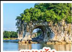
ฝางวงซิว