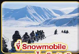
🏍️ ขี่ Snowmobile บนธารน้ำแข็งพันปี