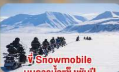
ที่ Snowmobile บนธารน้ำแข็งพันปี