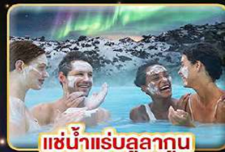
♨️ แช่น้ำแร่บลูลากูน