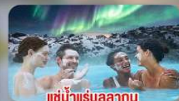
แช่น้ำแร่บลูลา गुณ