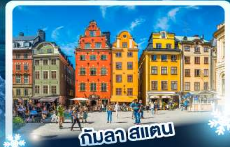
กับลา สแตน