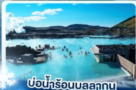
แช่น้ำร้อนบลูลากูน

เก็บไอซ์แลนด์ แดนภูเขาไฟคิรูกูเฟล และ แช่น้ำร้อนบลูลากูน