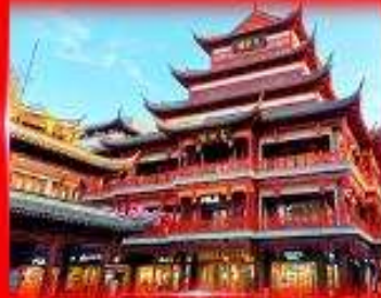
ตลาดร้อยปี เลิงหวังเมียว