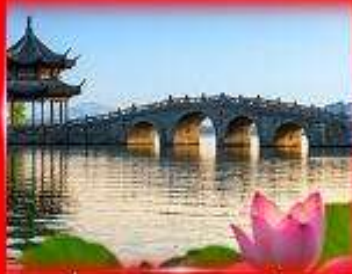
เที่ยวชมวิวทะเลสาบซีหู