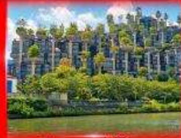
ตึก 1,000 ชั้นไม้

** ชำระค่าทัวร์ในนาม บริษัท นิดน้อย ทราเวล จำกัดเท่านั้น **