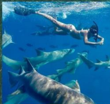
** Nurse Shark Snorkeling

** ชำระค่าทัวร์ในนาม บริษัท นิดน้อย ทราเวล จำกัดเท่านั้น **