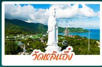
วัดเขลิ้นงู