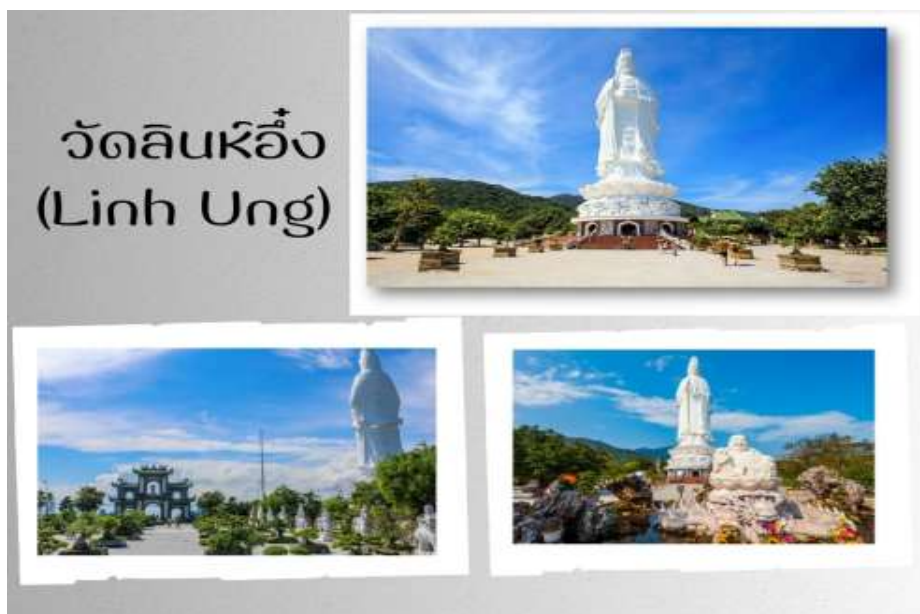
วัดลินฮืง (Linh Ung)

กลางวัน รับประทานอาหารกลางวัน ณ ภัตตาคาร ( มื้อที่ 7 )