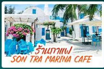
ร้านกาแฟ SON TRA MARINA CAFE