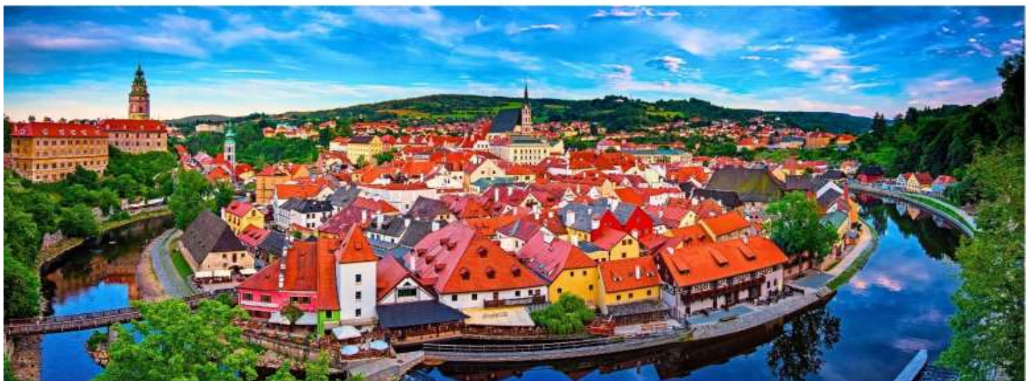
GG36 Oktoberfest 9 วัน 6 คืน (JX)

เที่ยง รับประทานอาหารกลางวัน ณ ภัตตาคารอาหารพื้นเมือง (มื้อที่ 1)