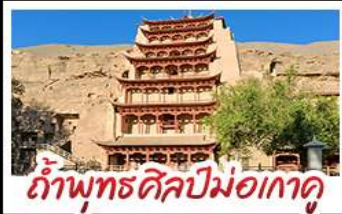
ทำพุทธศิลป์ม่อเถา

เป็นทรายครอง - สระน้ำวงพระจันทร์ ทะเลสาบเกลือดำ - ทำพุทธศิลป์ม่อเถา หุบเขาสายรุ้งจางเซ่ - ทะเลสาบชิงไห่