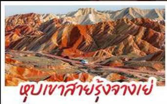
หุบเขาสายรุ้งจางเซ่