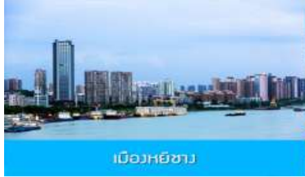
เมืองหยี่ชาง