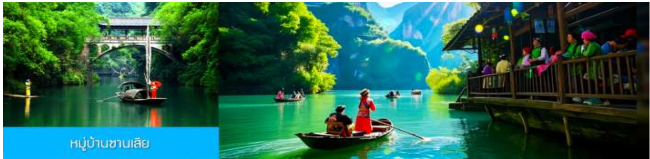
หมู่บ้านซานเสี๋ย