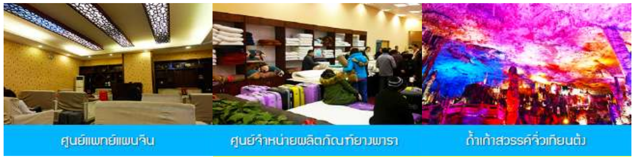
ศูนย์แพทย์แผนจีน

** ชำระค่าทัวร์ในนาม บริษัท นิดน้อย ทราเวล จำกัดเท่านั้น **