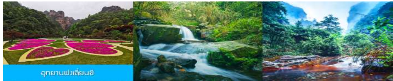
อุทยานฟงเหลียนซี