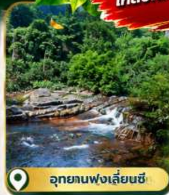
อุทยานฟงเหลียนซี