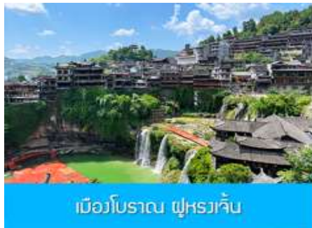
เมืองโบราณ ฝูหรงเจิน

จากนั้นนำท่านเดินทางสู่เมืองฝูหรงเจิน นำท่านเที่ยวชม เมืองโบราณ ฝูหรงเจิน 芙蓉古镇 เมืองโบราณเก่าแก่ขึ้นชื่อของมณฑลหูหนานที่โด่งดังจาก ภาพยนตร์เรื่อง ฝูหรงเจิน เป็นสถานที่ท่องเที่ยวระดับ 4A ที่ได้รับความนิยมจากนักท่องเที่ยวคู่กับเมืองโบราณฟ่งหวง เป็นสถานที่หลักในการถ่ายทำภาพยนตร์เรื่อง ฝูหรงเจิน ทำให้สถานที่แห่งนี้ยังได้รับความนิยมจากนักท่องเที่ยว จุดไฮไลท์ของเมืองโบราณแห่งนี้ นอกจากบ้านเรือนโบราณสวยเก๋ที่เป็นเอกลักษณ์เฉพาะของมณฑลหูหนาน ที่นี้ยังมีน้ำตกขนาดใหญ่ที่สวยงามกลางเมืองที่เป็นจุดเช็คอิน