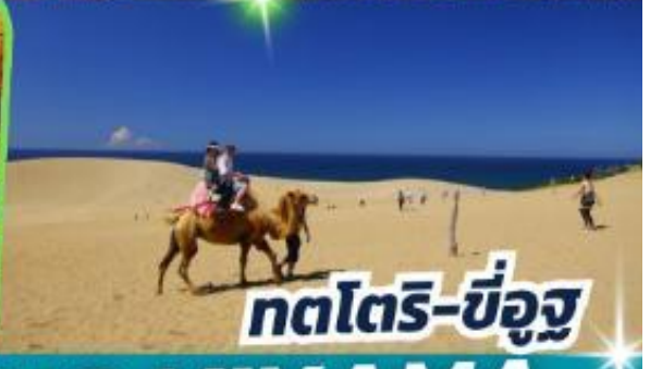
กตโตริ-ซ็องสุ