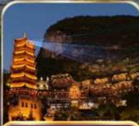
หมู่บ้านโบราณเฟิงหลินปู้ (รวมรถแบค)

คุณหมิง ซิงอี เมืองโบราณเฟิงปู้ อุทยานป่าภูเขามึนยอด 6 วัน 5 คืน