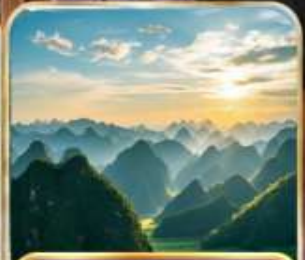
อุทยานป่าภูเขามึนยอด (รวมรถแบคเตอร์)