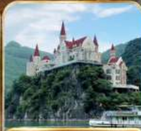
ล่องทะเลสาบวั้นเฟิงหู