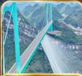
สะพานฮวาเกียง