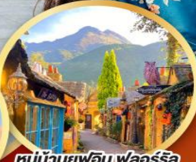
หมู่บ้านยูฟูอิน ฟลอร์ริส