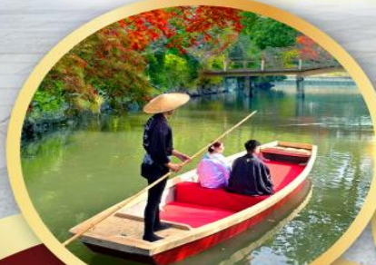
กิจกรรมล่องเรือยานากาวะ