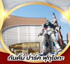
กันดั้ม ปาร์ค ฟุคุโอกะ