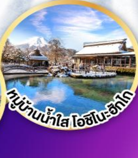
หมู่บ้านน้ำใส โอชิโนะฮิตาโกะ