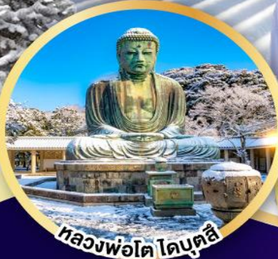
หลวงพ่อโต โดบุตสึ