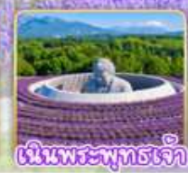
สวนชิโกะโตะโอคะ