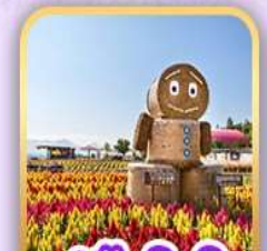
สวนซึกิไซโนะโอกะ