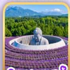
เนินพระพุทธรูป