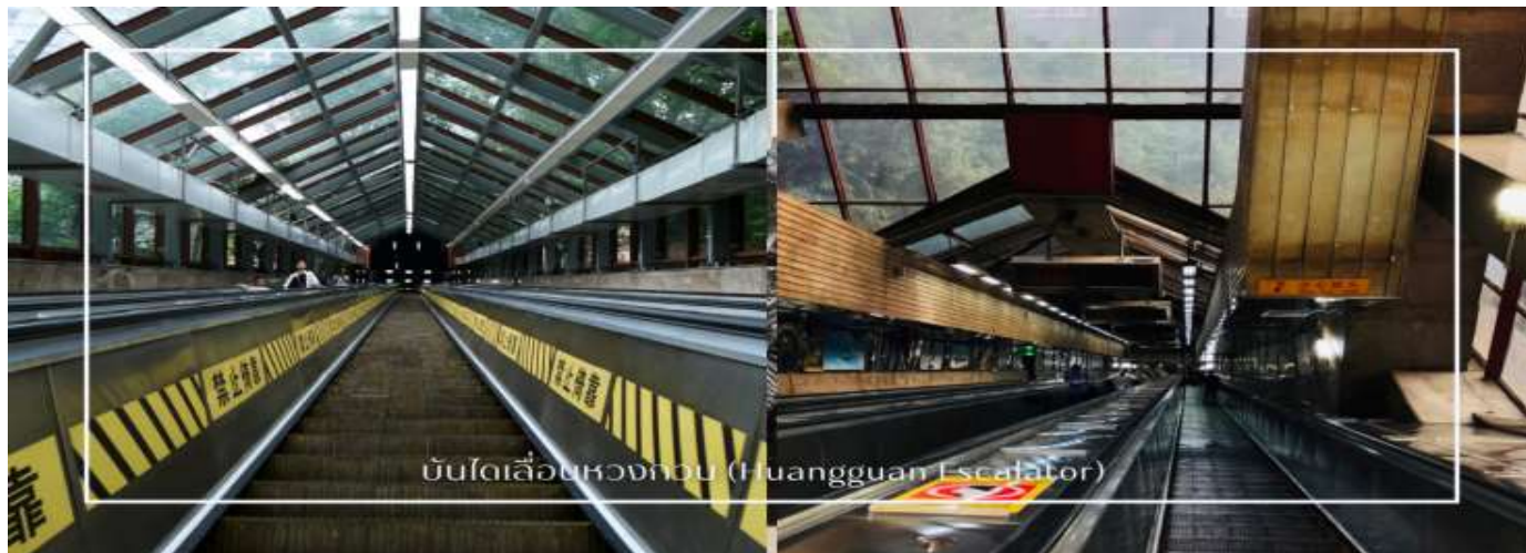
บันไดเลื่อนหวงกวน (Huangguan Escalator)

สะดวกให้กับทั้งคนท้องถิ่นและนักท่องเที่ยวในการสัญจรผ่านพื้นที่ที่มีความลาดชัน การขึ้นลงบันไดเลื่อนถือเป็นประสบการณ์ที่เปิดโอกาสให้ได้ชมทัศนียภาพของเมืองในมุมที่แตกต่าง