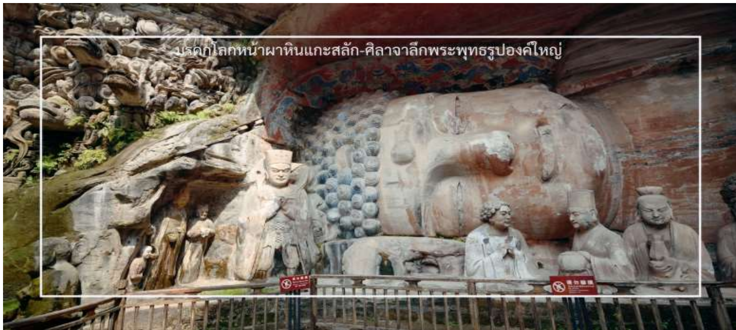
บรมกโลกหน้าผาหินแกะสลัก-ศิลาจากลึงพระพุทธรูปองค์ใหญ่

ธรรมชาติ ทำให้เป็นสถานที่ที่เหมาะสมสำหรับการเยี่ยมชมและถ่ายรูป สะพานลอยฟ้า Raffles City Chongqing ไฮไลต์สำคัญคือสะพานกระจกยาวประมาณ 300 เมตร ซึ่งเชื่อมอาคารสูง 4 หลังเข้าด้วยกัน และถือเป็นหนึ่งใน skybridge ที่สูงและยาวที่สุดในโลก ภายในประกอบด้วยจุดชมวิวพื้นที่กระจก ร้านอาหาร สวนลอยฟ้า คาเฟ่ และพื้นที่ชมวิวแบบพาโนรามา สามารถมองเห็นวิวแม่น้ำและเส้นขอบฟ้าของเมืองฉงชิ่งได้แบบ 270 องศา เดินทางเข้าโรงแรมที่พัก Starway Hotel ระดับ 3 ดาวหรือเทียบเท่า