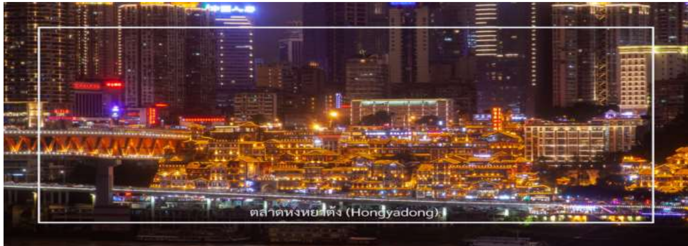
ตลาดหงหยาดง (Hongyadong)

** ชำระค่าทัวร์ในนาม บริษัท นิดน้อย ทราเวล จำกัดเท่านั้น **