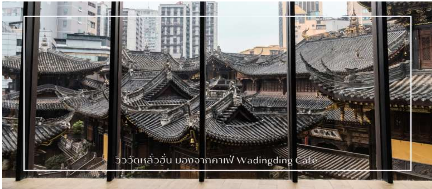
วิววัดหลวอัน มองจากคาเฟ่ Wadingding Cafe

** ชำระค่าทัวร์ในนาม บริษัท นิดน้อย ทราเวล จำกัดเท่านั้น **