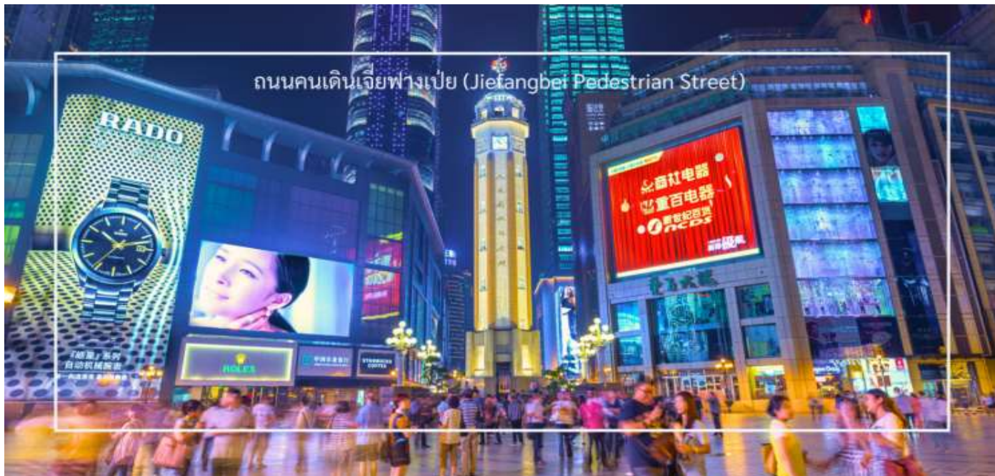
ถนนคนเดินเจียงเป่ย์ (Jiefangbei Pedestrian Street)

คึกคัก มีร้านค้า ร้านอาหาร และสถานบันเทิงมากมาย ถนนนี้ตั้งอยู่ใกล้กับสถานที่ท่องเที่ยวสำคัญอื่นๆ เช่น มหาศาลาประชาชนแห่งเมืองฉงชิ่ง ทำให้สามารถเดินเที่ยวชมได้อย่างสะดวก ถนนสายนี้มีบรรยากาศที่มีชีวิตชีวา โดยเฉพาะในช่วงเย็นที่มีแสงไฟและการแสดงต่างๆ ที่ทำให้บรรยากาศน่าสนใจยิ่งขึ้น และยังเต็มไปด้วยร้านค้าแบรนด์เนม ร้านค้าท้องถิ่น และตลาดที่ขายสินค้าต่างๆ เช่น เสื้อผ้า เครื่องประดับ และของที่ระลึก ท่านสามารถแวะช้อปปิ้งร้านดัง “POPMART” ร้านดังจากจีน ที่รวมพิกเกอร์ดีไซน์เก๋และตุ๊กตาน่ารักหลากหลายซีรีส์ยอดนิยม เช่น Molly, Dimoo, Labubu และอีกมากมาย ที่สายสะสมของเล่นไม่ควรพลาด