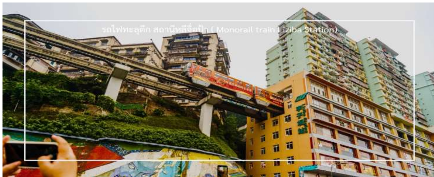
รถไฟทะลุติ๊ก สถานีหลี่จื่อป้า ( Monorail train Liziba Station)

นำท่าน นั่งรถไฟทะลุติ๊ก (Monorail train Liziba Station) เป็นหนึ่งในประสบการณ์ที่น่าสนใจ และเป็นเอกลักษณ์ในเมืองฉงชิ่ง รถไฟสายนี้มีเส้นทางที่ผ่านอาคารและที่อยู่อาศัย ทำให้ผู้โดยสารรู้สึกเหมือนกำลังนั่งรถไฟที่ทะลุผ่านตึกสูง เส้นทางที่น่าสนใจในรถไฟนี้รวมถึงสถานีที่มีชื่อเสียง เช่น สถานีหลี่จื่อป้า (Liziba Station) ซึ่งตั้งอยู่ในพื้นที่ที่มีความหนาแน่นของประชากร การนั่งรถไฟทะลุติ๊กนี้เป็นวิธีที่ยอดเยี่ยมในการสัมผัสกับวัฒนธรรมเมืองฉงชิ่งและชื่นชมกับการพัฒนาเมืองที่น่าทึ่ง หากคุณมีโอกาสไปเยือนฉงชิ่ง อย่าลืมลองนั่งรถไฟสายนี้เพื่อสัมผัสประสบการณ์ที่ไม่เหมือนใคร