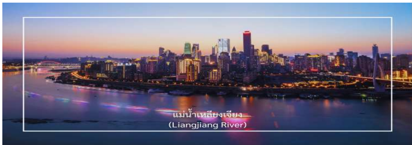
แม่น้ำเหลียงเจียง (Liangjiang River)

แม่น้ำเหลียงเจียง (Liangjiang River) พื้นที่จุดบรรจบของแม่น้ำทั้งสอง ซึ่งเป็นหนึ่งในมุมมองที่สวยงามที่สุดของเมืองฉงชิ่ง ซึ่งประกอบด้วย แม่น้ำแยงซี (Yangtze River) – เป็นแม่น้ำสายที่ยาวที่สุดในจีน และเป็นสายหลักของประเทศ แม่น้ำเจียงหลิง (Jialing River) – เป็นแม่น้ำสาขาที่สำคัญซึ่งไหลลงสู่แม่น้ำแยงซี พื้นที่ที่แม่น้ำทั้งสองสายนี้มาบรรจบกันมีชื่อว่า “เหลียงเจียง” กิจกรรมล่องเรือสองแม่น้ำ (Two Rivers Cruise) ซึ่งได้รับความนิยมมากในหมู่นักท่องเที่ยว เพราะจะได้ชมเส้นขอบฟ้าของฉงชิ่งยามค่ำคืน ตึกระฟ้า แสงไฟเมือง และวิวริมแม่น้ำที่สวยงามเป็นเอกลักษณ์